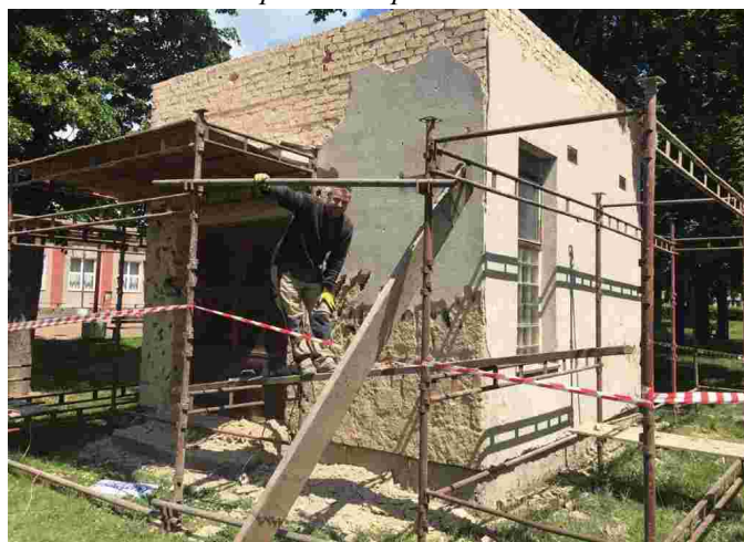
Rekonstrukce budovy zázemí na sokolovně