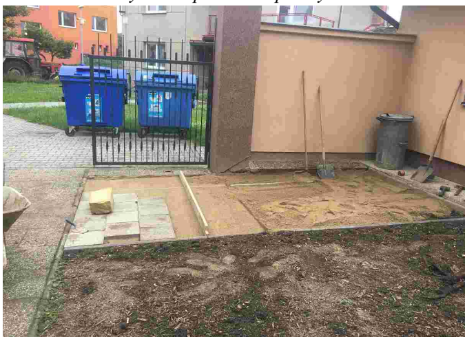
Úprava dvorku v MŠ