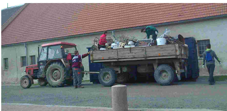
Sběr železného šrotu

Jak dobře víme, v březnu se nám všem velmi změnil dosavadní život. S příchodem koronavirové hrozby byl v celém státě vyhlášen nouzový stav a s ním spojený zákaz shromažďování. Pro sportovní družstva, ať dospělých tak dětí, to znamenalo nemalý zásah do jejich činnosti. Byly zrušeny veškeré soutěže, tréninky a jiné aktivity. Např. se v Majetíně neuskutečnila Okrsková soutěž plánovaná na konec dubna, ani Dětský den plánovaný na začátek června. První soutěž, na kterou se všichni těšíme, by se měla uskutečnit 27. 6. 2020. Bude to již tradiční majetínská Pohárová soutěž pro děti i dospělé.