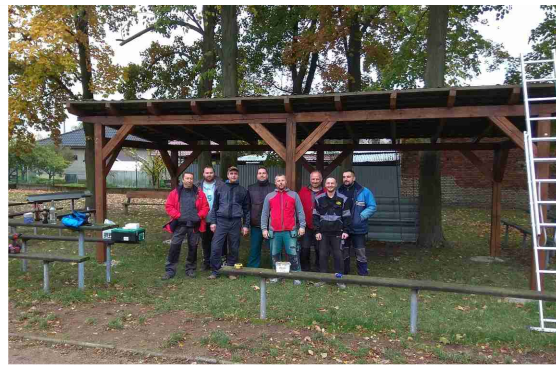
Stavba pergoly na sokolovně

Ve středu 5. 12. uspořádali hráči a příznivci Lions Majetín Mikulášskou nadílku. V podvečer vyrazila početná skupina, aby dětem, jimž rodiče návštěvu těchto bytostí objednali, přinesla radost a nadílku. Někde bylo potřeba děti trochu postrašit, jinde zase čertice a malý čertík pomáhali dětem strach překonat. Ve všech případech byly obdarované děti spokojené, stejně tak i jejich rodiče, kterým děti naslibovaly hory doly a minimálně pár dalších dní budou hodné a poslušné. Že jim to nevydrží po celý rok? Nevadí, příště se Mikuláš s andělem a čerty přijdou podívat zase. Závěrem bych chtěl poděkovat všem, co přispěli do andělského košíčku nějakou finanční částkou. Celkový výtěžek 2 300 Kč bude věnován na dobročinnou věc.