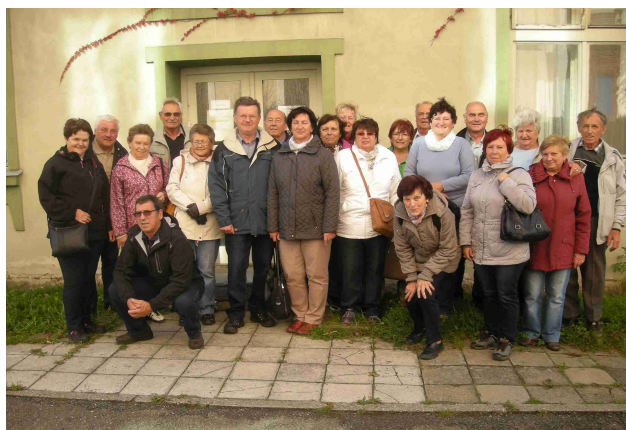
Zájezd klubu seniorů