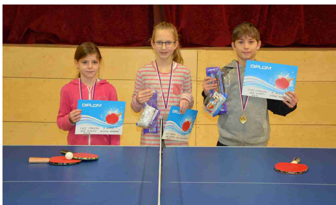
Smeč starostky obce – kategorie dětí