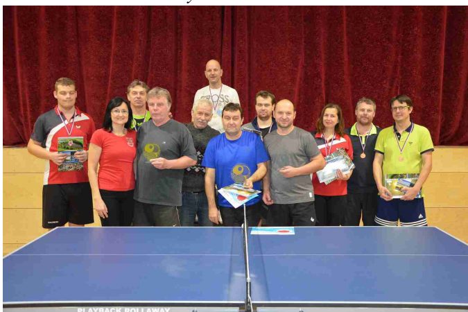
Smeč starostky obce – kategorie dospělí