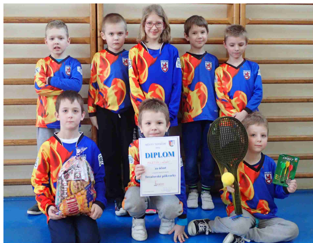
Mladší děti na akci Tovačovské piškvorky

SDH Majetín bude pořádat sběr železa 14. 4. 2018 od 9:00 hodin a utržené peníze se použijí na výzbroj sportovních družstev.