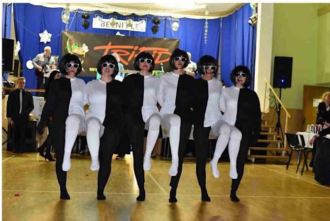
Černobílé vystoupení na obecním plese

Vážení a milí spoluobčané, vítám vás při čtení prvního vydání Zpráv z Majetína roku 2018. Začátek roku je každoročně spjat s plesovou sezónou . V naší obci jsme mohli navštívit 3 plesy - ples T. J. Sokol s kapelou NO SIGNAL, obecní ples ve stylu černé a bílé s kapelou TRIFID a karneval SRPŠ s kapelou ESMERALDA. Všechny akce nabídky účastníkům dobrou