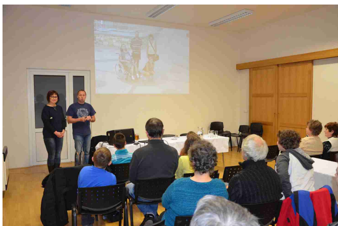
Cestovatelská beseda „Ve stopách vikingů“