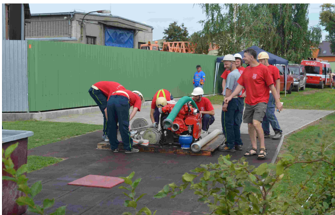
Soutěž hasičů ve Velkém Týnci