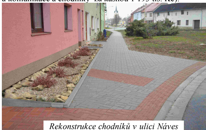
Rekonstrukce chodníků v ulici Náves

K moderní obci patří i moderní vybavenost. V podzimních měsících byla dokončena rekonstrukce části chodníků na návsi a navazujících komunikací u školy a za kašnou. Celková cena činí 3 651 tis. Kč (chodníky 2 074 tis. Kč, z toho dotace ze Státního fondu dopravní infrastruktury byla 1 194 tis. Kč; komunikace u školy 383 tis. Kč a komunikace a chodníky za kašnou 1 193 tis. Kč).