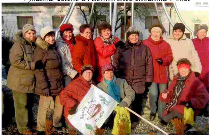
Báječný ženský na novoroční vycházce