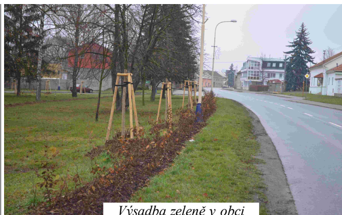
Výsadba zeleně v obci

Projekt Obnova zeleně ve vybraných částech obce řešil kácení 97 starých stromů a keřů, ošetření 70 ks stromů ořezem nebo vazbou a výsadbu 136 ks stromů a 1 283 ks keřů. Výsadba byla uskutečněna v ulicích Náves, Za Humny, U Sokolovny a podél toku Dolkovice u majetínské pískovny za celkovou částku 1 027 tis. Kč, dotace z Operačního programu životní prostředí činila 800 tis. Kč. Při realizaci obou akcí bylo po obci trošku rušno, ale věřím, že výsledek stojí za to.