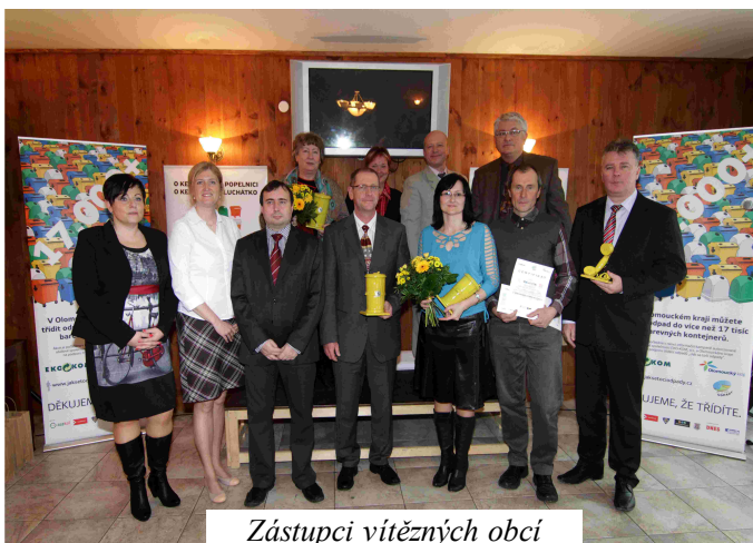
Zástupci vítězných obcí

Města: 1. místo Jeseník, 2. místo Olomouc, 3. místo Konic