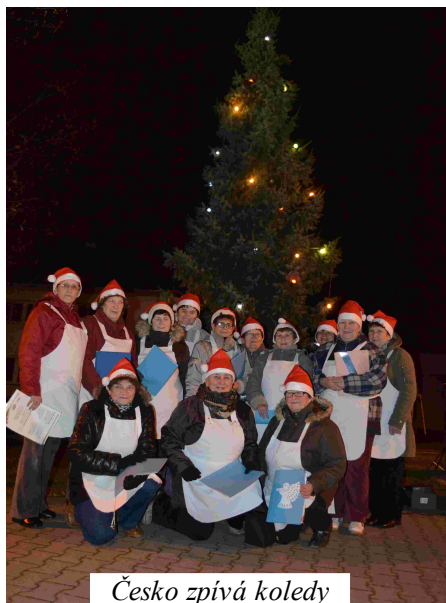
Česko zpívá koledy

Naše country taneční skupina již 7 let předvádí své tance. V roce 2013 jsme vystupovali 20x na různých akcích, nejen v Majetíně, ale například v Lošticích na "Country bále", v Tovačově na oslavách 15-tých narozenin Ústavu pro senory, v Tršicích na setkání spolužáků "70tiletých", dále na plesech, MDŽ, hodech a při setkávání seniorů. Každoročně se účastníme přehlídky seinorských tanečních skupin Olomouckého kraje ve Velkém Týnci. Pravidelně každý čtvrtek v sokolovně zkusíme nové tance, opakujeme si i ty již známé a plánujeme různá zábavná vystoupení. Na vánočním setkání majetínských seniorů se stalo