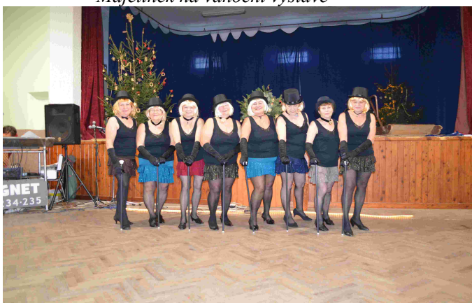
Báječný ženský na setkání seniorů