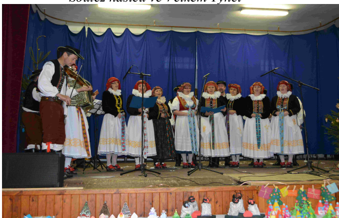
Majetinek na vánoční výstavě