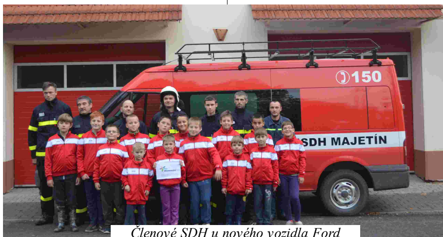
Členové SDH u nového vozidla Ford

a společenských akcí v obci jako kácení máje, hodová zábava, neckiáda, kladení věnců na místním hřbitově apod.