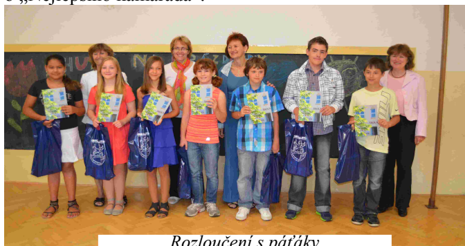
Rozloučení s páťáky

Na slavnostním ukončení školního roku jsme se rozloučili s žáky, kteří od září nastoupili do šestých tříd nebo na gymnázia. Byli to 4 chlapci a 4 děvčata. Také jsme vyhlásili výsledky celoroční soutěže v každé třídě o „Nejlepšího kamaráda“.