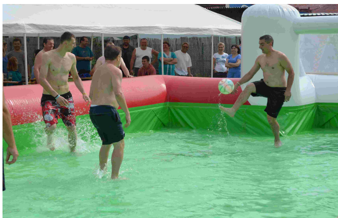
Hodové turnaje - vodní fotbal