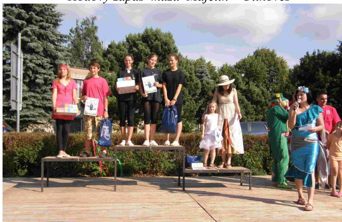
Neckiáda - stupně vítězů - děti