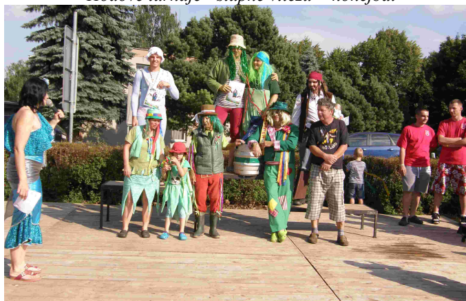
Neckiáda - stupně vítězů - dospělí