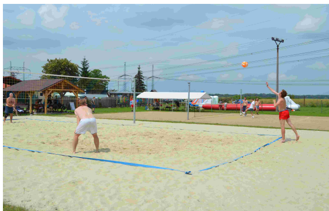
Hodové turnaje - beach volejbal