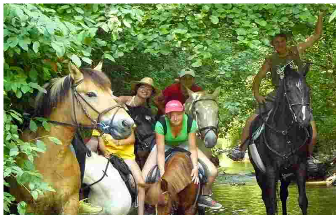
Tábor u koní