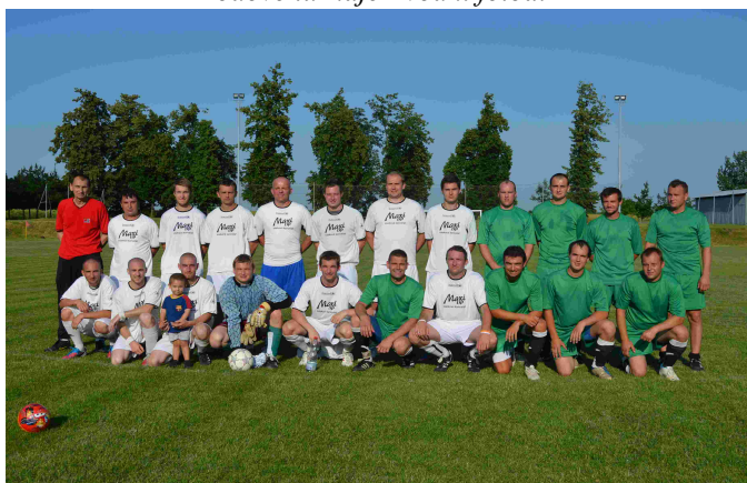
Hodový zápas mužů Majetín – Otínoves