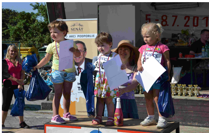
Triatlon – stupně vítězů - nejmenší děti