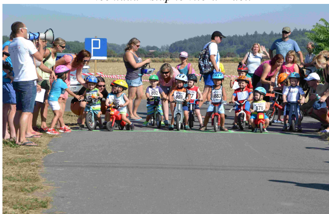
Triatlon - závody dětí