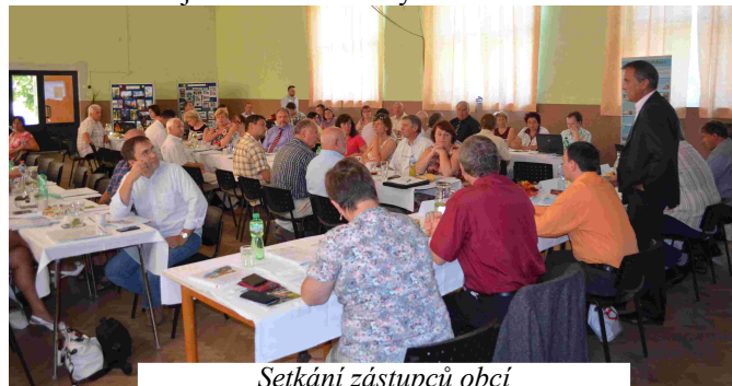
Setkání zástupců obcí