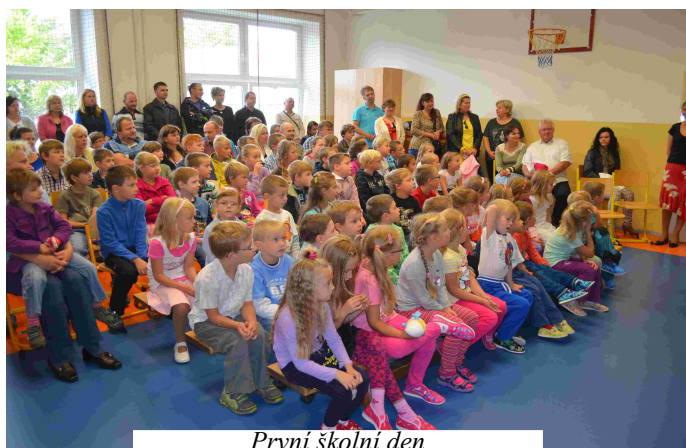
První školní den