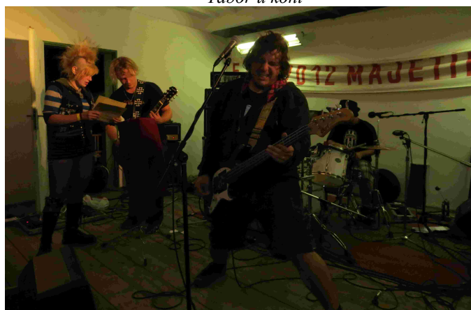
Session - Kytary in Majetín