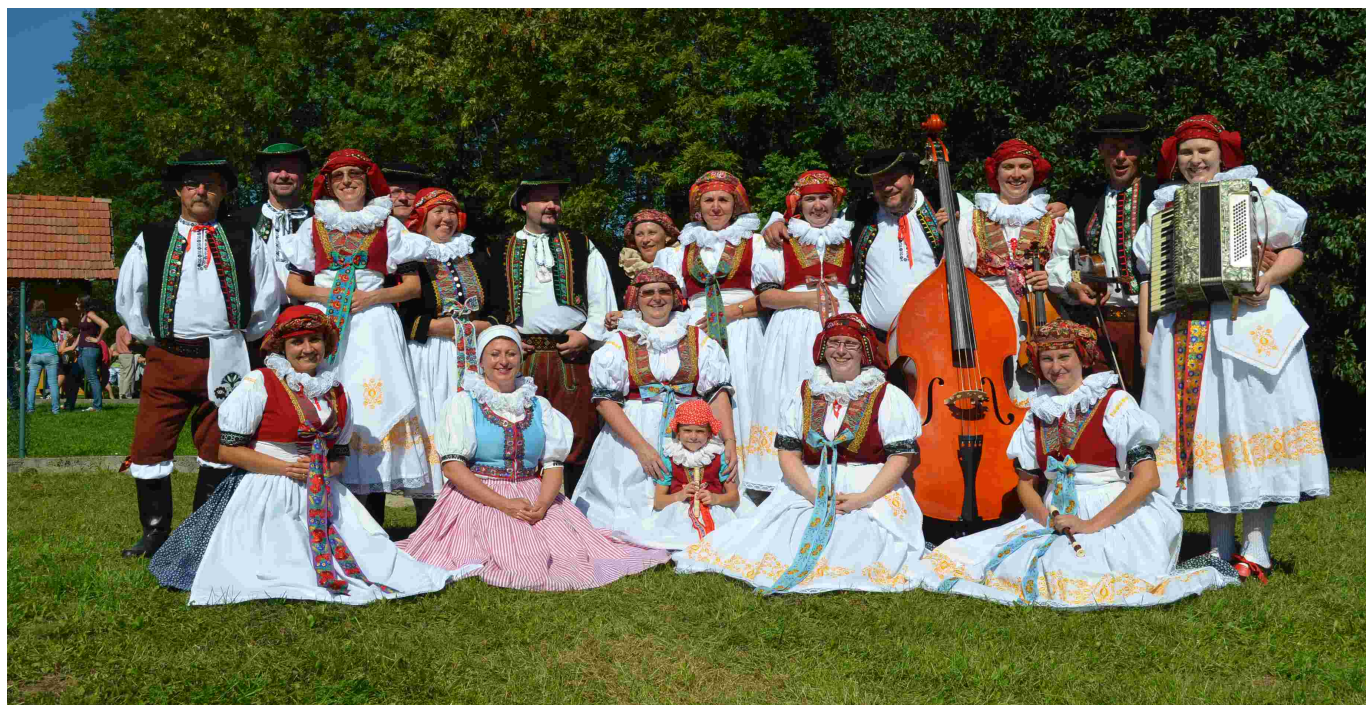
Majetínek na Slovacké jaternici v obci Březová