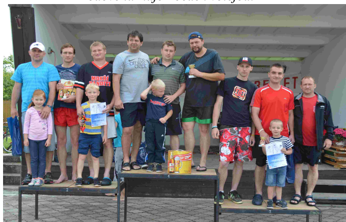
Hodové turnaje - stupně vítězů - nohejbal