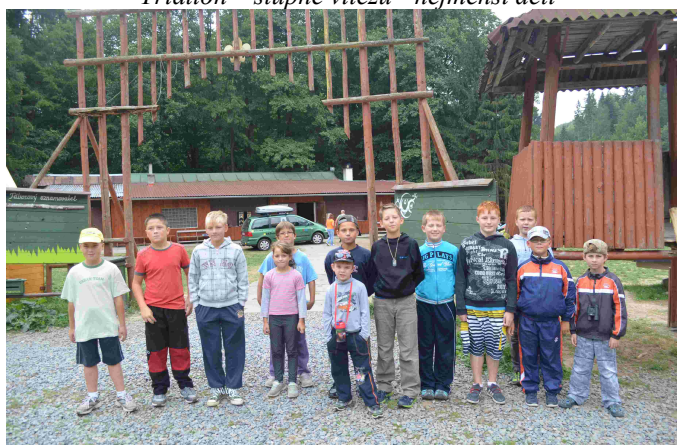
Mladí hasiči na tábore v Nejdku