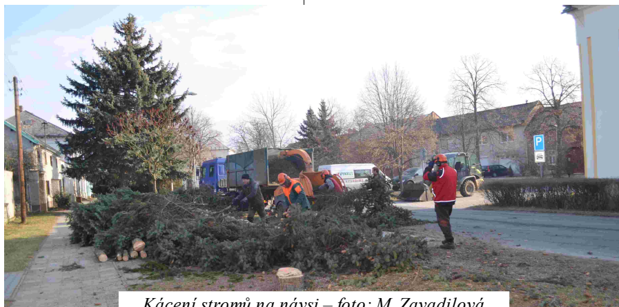
Kácení stromů na návsi

Věřím, že nová zeleň bude pro naši obec přínosem, dojde k pročištění, prosvětlení a ke sjednocení rázu celé obce. Dosavadní výsadba byla prováděna bez komplexního pojetí. Byly sázeny jehličnaté stromy, které se hodí především do lesů a horských krajín, ne do hanácké obce. Kácení těchto stromů mnohé spoluobčany zasáhl, především tím, že je třeba sami vysadili a viděli vyrůstat, což je pochopitelné. Kácení bylo provedeno nejenom z důvodu estetického, ale také zdravotního. Většina byla již přerostlá a přestárlá ohrožující okolí.