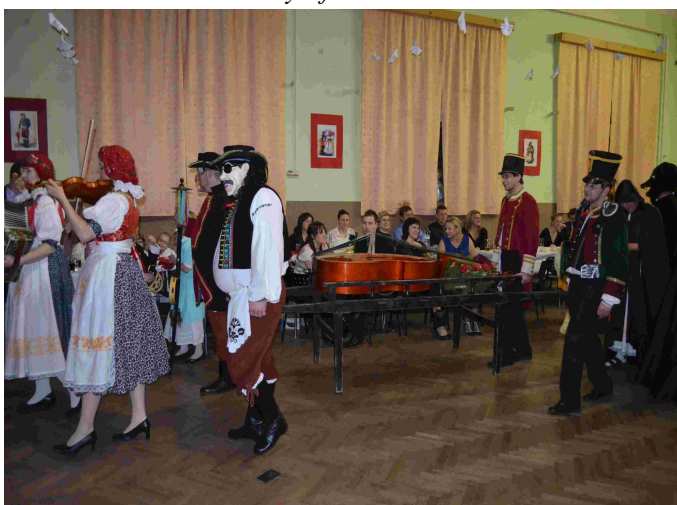
Pochování basy