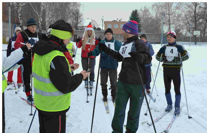
Královské zimní hry