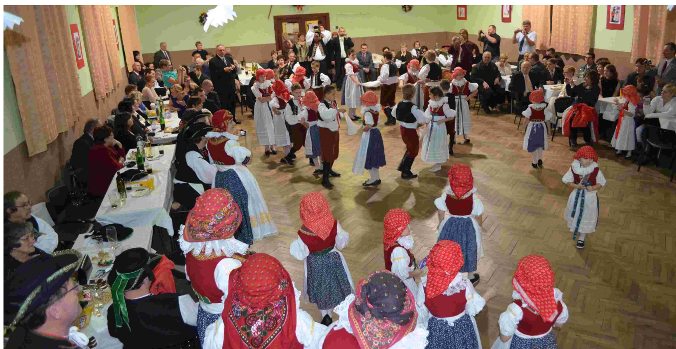
Karneval SRPŠ, dětský karneval, pyžamový bál, hanácké bál