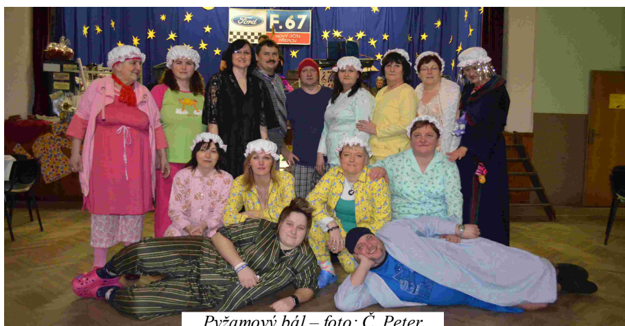
Pyžamový bál

Siesta Opava, které se bude konat v květnu. | Poslední pozvánka, kterou vám nabízíme je na pálení čarodějnic