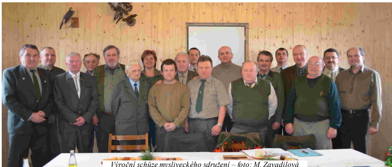
Výroční schůze mysliveckého sdružení