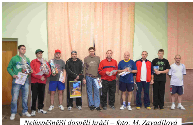
Nejúspěšnější dospělí hráči