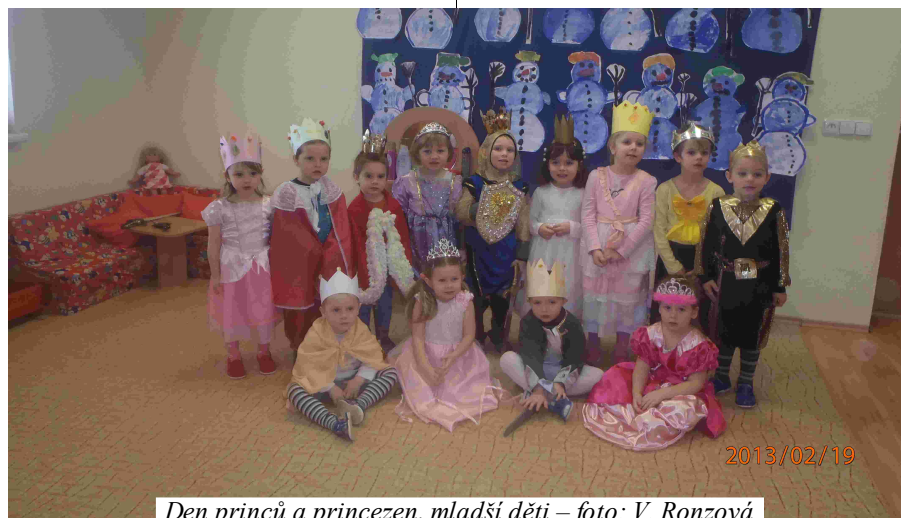
Den princů a princezen, mladší děti

téma „Bezpečnost“. 14. 2. 2013 se konala v Kokorách taneční soutěž pro děti ZŠ (1.- 9. tříd). Této soutěže se zúčastnily i 3 žákyně majetínské základní školy (Anetka Mikešová, Nelinka Kolečářová, Verunka Přikrylová). Všechna děvčata ze 2. třídy výborně reprezentovala naši ZŠ a dovezla si následující ocenění.