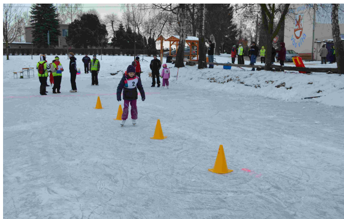
Královské zimní hry