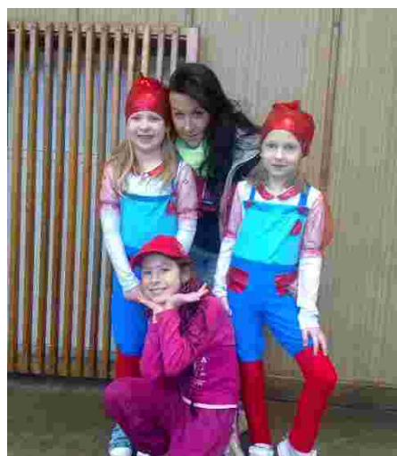
Taneční soutěž Kokory – foto: archiv ZŠ

Aby ani děti nepřišla zkrátka, druhý den (po úklidu po plese) se mohl chystat v sokolovně (tentokrát pro ty naše nejmenší) „Maškarní karneval pro děti“, který byl plný her a zábavy. Tím můžeme říct, že školákům krásně začaly jarní prázdniny, které tento rok vyšly pro olomoucký kraj v týdnu od 11. - 15. března.