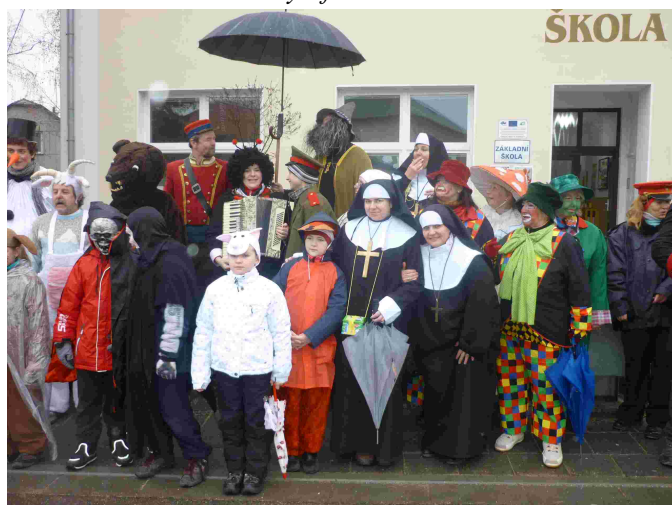
Vodění medvěda