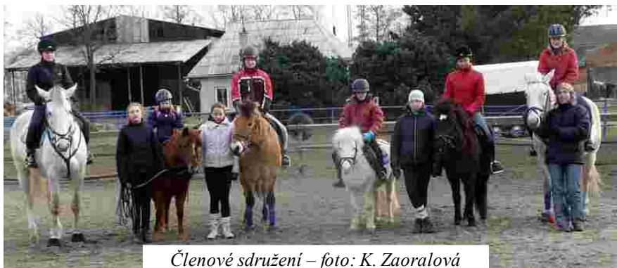
Členové sdružení