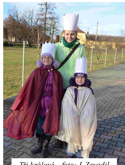
Tři králové

Máme za sebou úspěšnou plesovou sezónu – sokolský ples, hanácký bál, pyžamový bál a maškarní karneval pro dospělé a pro děti. Příprava těchto akcí je vždy náročná, od roznášení pozvánek, výzdoby sálu, přípravy