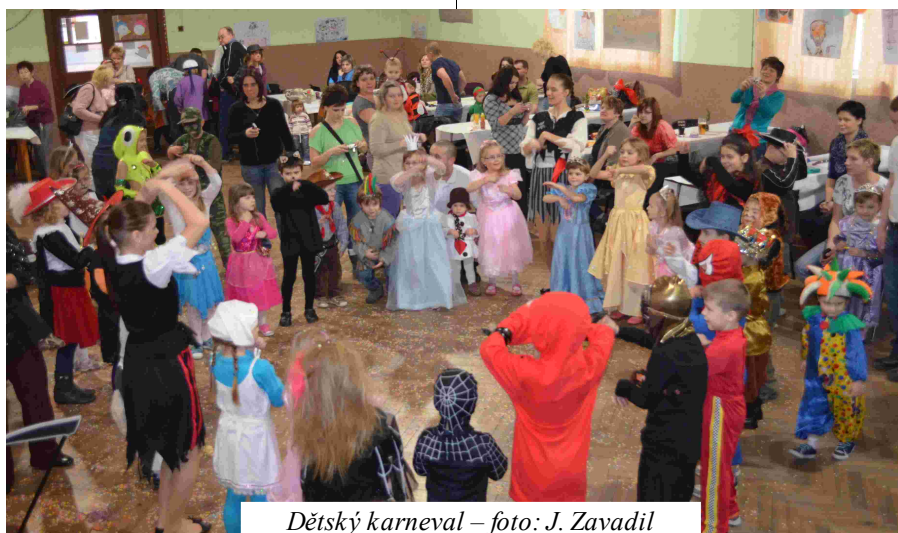
Dětský karneval