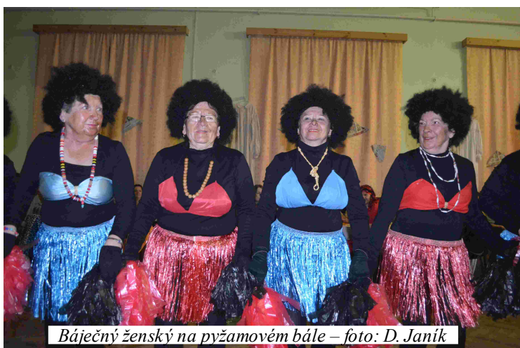
Báječný ženský na pyžamovém bále – foto: D. Janík

Naše taneční skupina začala sedmý rok svého působení hned několika vystoupeními.