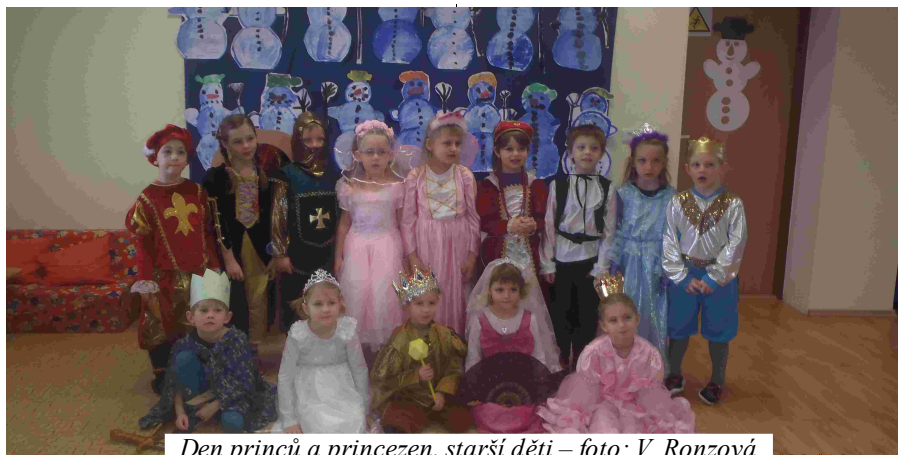
Den princů a princezen, starší děti – foto: V. Ronzová

Ještě jsme si ani nezvykli, že se píše rok 2013 a už máme za sebou první tři měsíce tohoto roku. A tak se podíváme a zavzpomínáme, jak nám ten rok začal a co připravil za události v základní a mateřské škole.