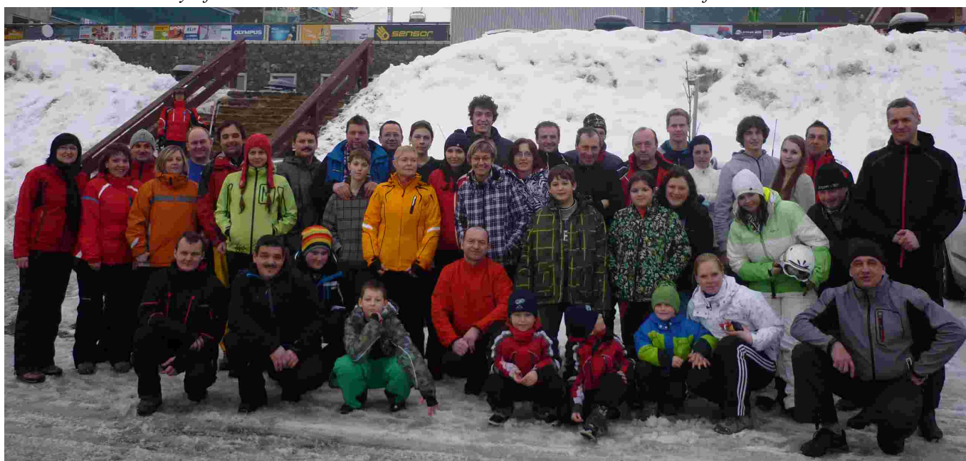
Lyžařský zájezd Červená Voda