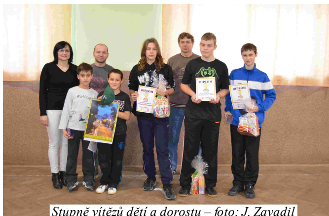
Stupně vítězů dětí a dorostu