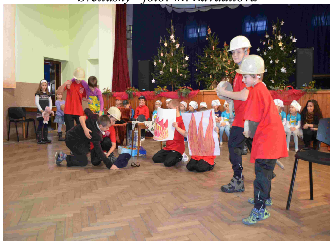
Vystoupení mladých hasičů a dětí MŠ při setkání seniorů