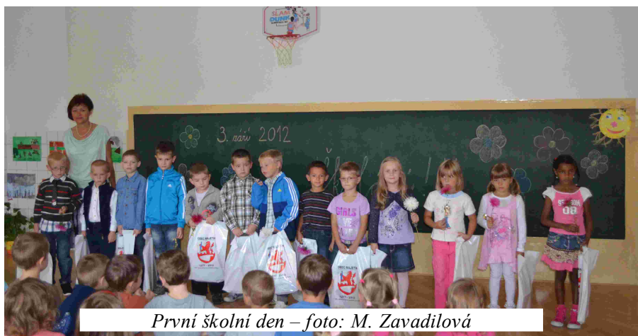
První školní den

Ve školním roce 2012/2013 bude naše ZŠ opět trojtřídní se samostatným 1. ročníkem. Celkem ji navštěvuje 51 žáků. Do 1. ročníku nastoupilo 13 žáků, ve II. třídě (2. a