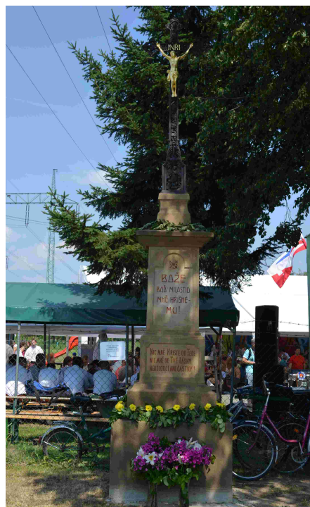
Zrekonstruovaný kříž

Na bohatém doprovodném programu oslav 735 let obce