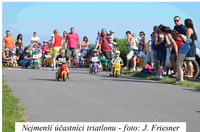
Nejmenší účastníci triatlonu