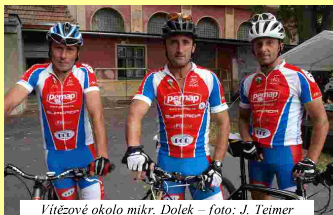
Vítězné okolo mikr. Dolek