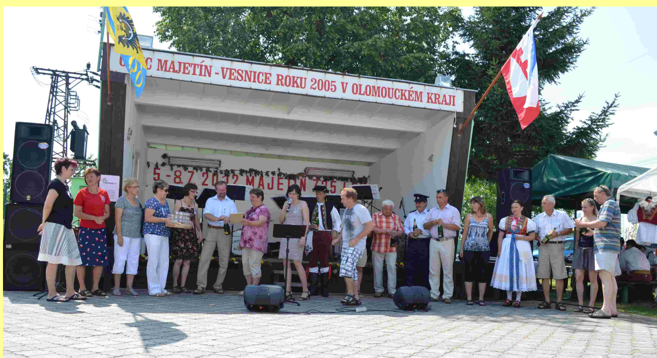
Folklorní kroužek Majetínek, večerní ohňostroj, křest knihy Majetín v proměnách času – foto: J. Zavadil, R. Koutný