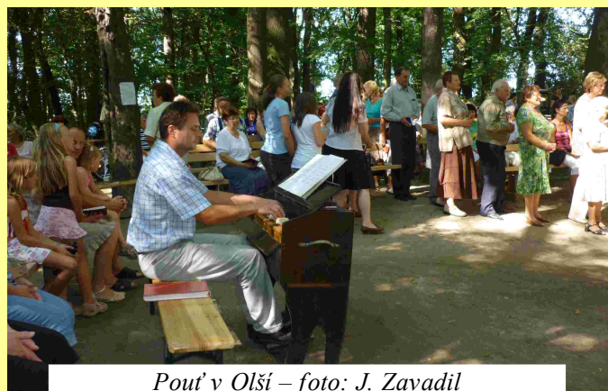
Pouť v Olši