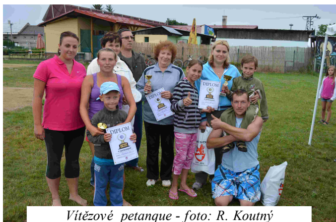
Vítězové petanque