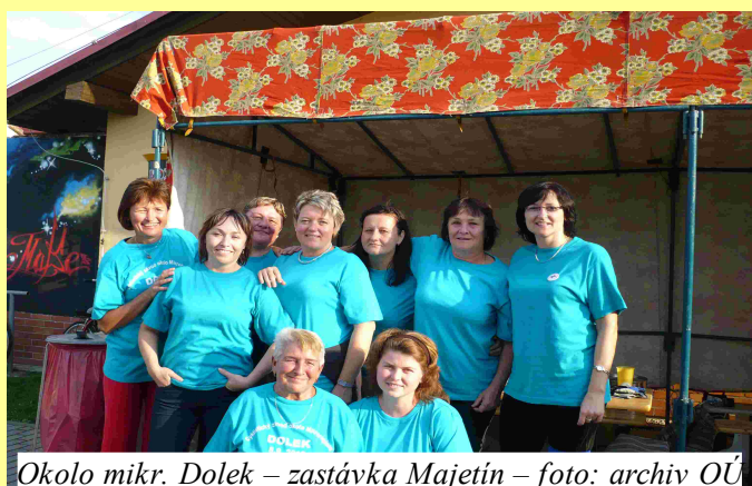
Okolo mikr. Dolek – zastávka Majetín