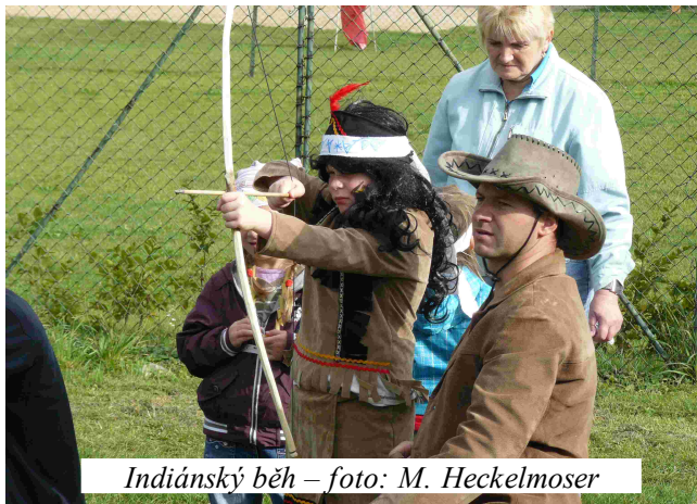
Indiánský běh

ovlivňování výsledků soutěže ze strany organizátorů jsou nemístné a v tomto případě zcela zbytečné. Jak jsem již uvedla „jsme lidi“, a tak k omylům dochází i v prestižních soutěžích, kde jsou ve hře mnohdy i velké finanční částky. V případě „indiánského běhu“ jde především o to, aby se děti odpoutaly od dnešní elektronické zábavy, daly si trochu do těla a vstřebaly základy z tajů přírody. Navíc si každý soutěžící odnese kromě zážitků i několik drobných odměn. Děláme to rádi a děláme to pro děti! Pokud má někdo pocit, že by chtěl přijít se svou troškou do mlýna, rádi přijmeme vzácné rady pro zlepšení organizace a průběhu této soutěžní akce. Věřím, že se v hojném počtu sejdem i v příštím roce.