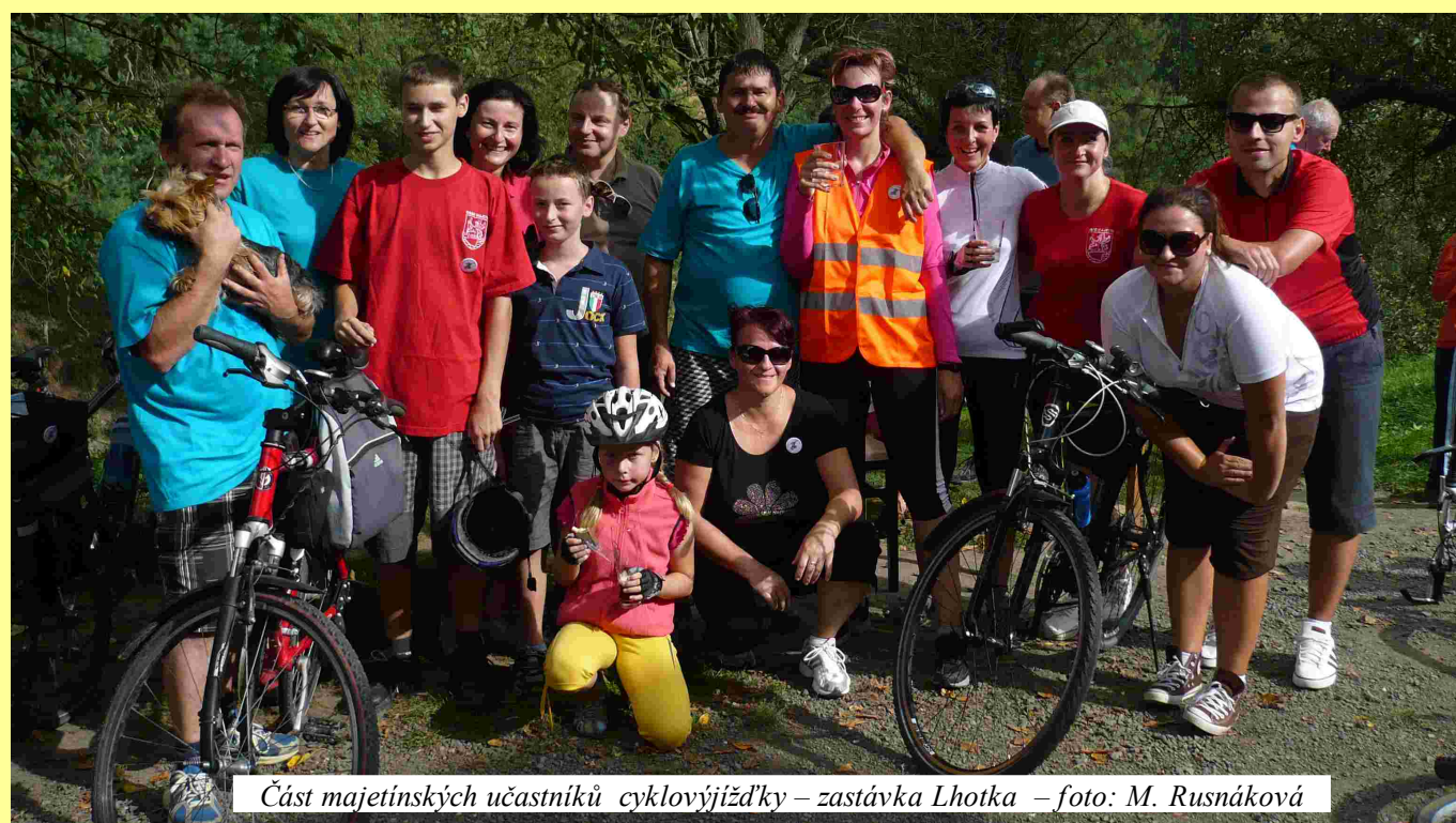
Část majetínských účastníků cyklovýjžd'ky – zastávka Lhotka – foto: M. Rusnáková

Vydává Obec Majetín, Lipová 25, 751 03 Majetín, tel: 581 741 740, IČO 299197