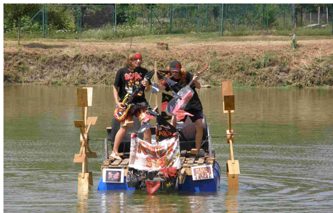
„Rock stars“