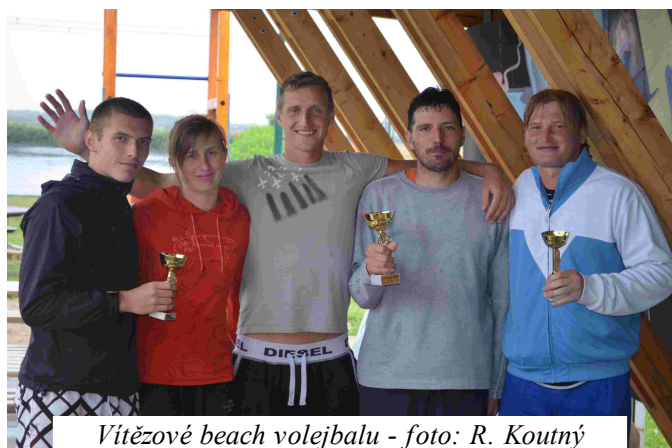
Vítězové beach volejbalu