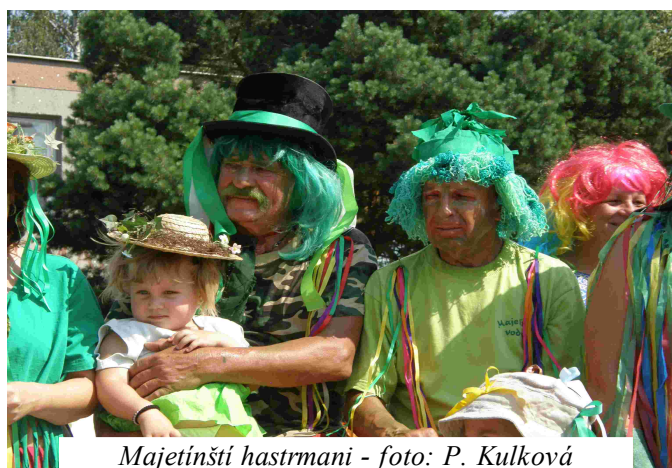
Majetínští hastrmani