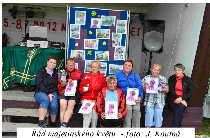
Řád majetínského květu