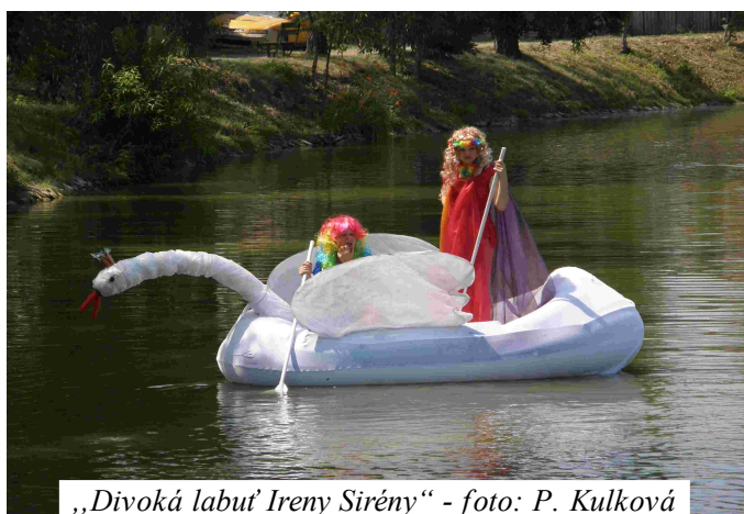
„Divoká labuť Ireny Sirény“