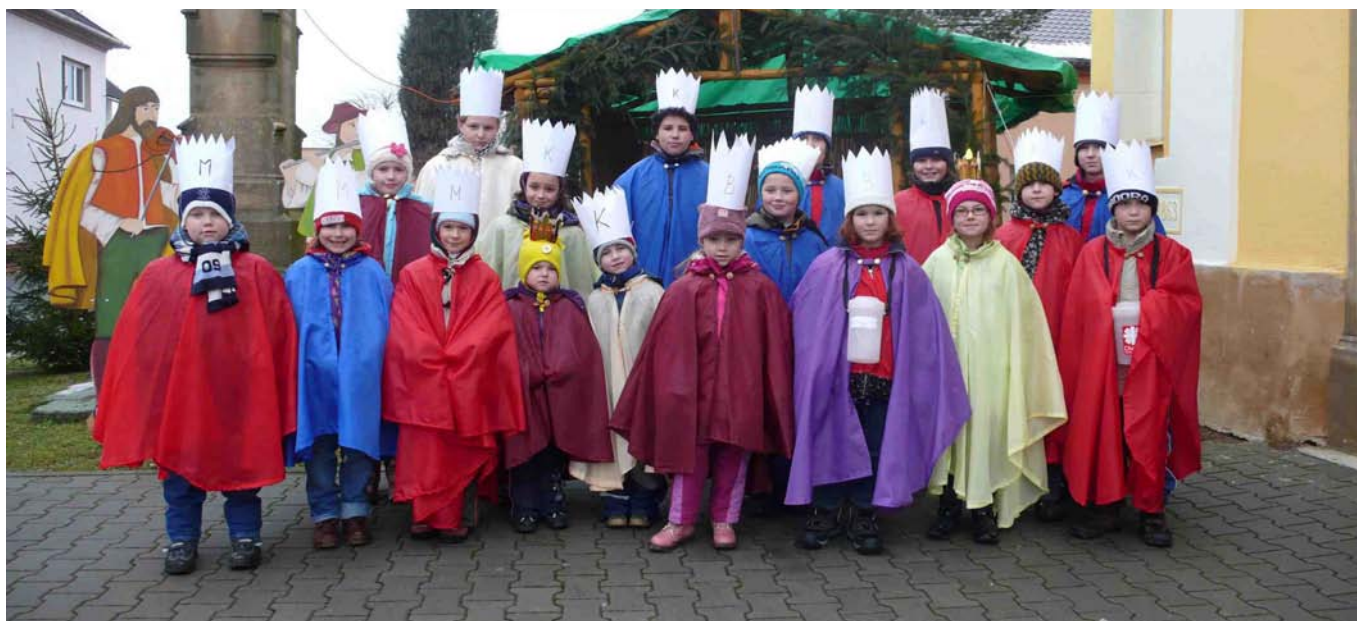
Koledníci Tříkrálové sbírky

Vydává Obec Majetín, Lipová 25, 751 03 Majetín, tel: 581 741 740, IČO 299197