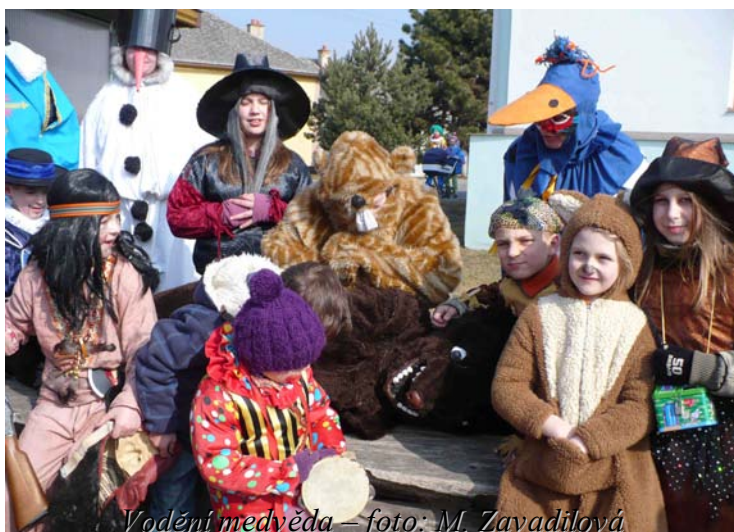
Vodění medvěda

Za folklorní soubor Majeťínek Miroslava Šmidová