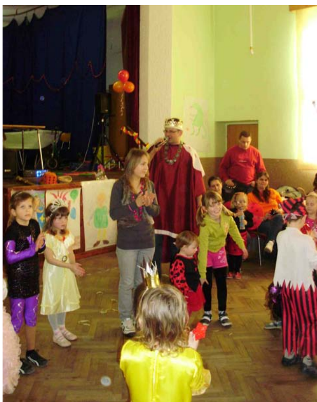
Dětský karneval

První měsíc po Novém roce je pro každou školu typický zkoušením, písemkami, vylepšováním známek, nervozitou, velkou snahou všech o co nejlepší pololetní vysvědčení. A v naší škole se pěkné vysvědčení povedlo téměř všem dětem.