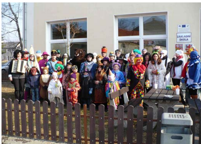
Vodění medvěda