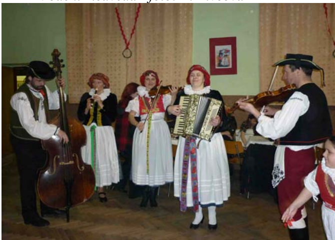
Lidová muzička z Majetína