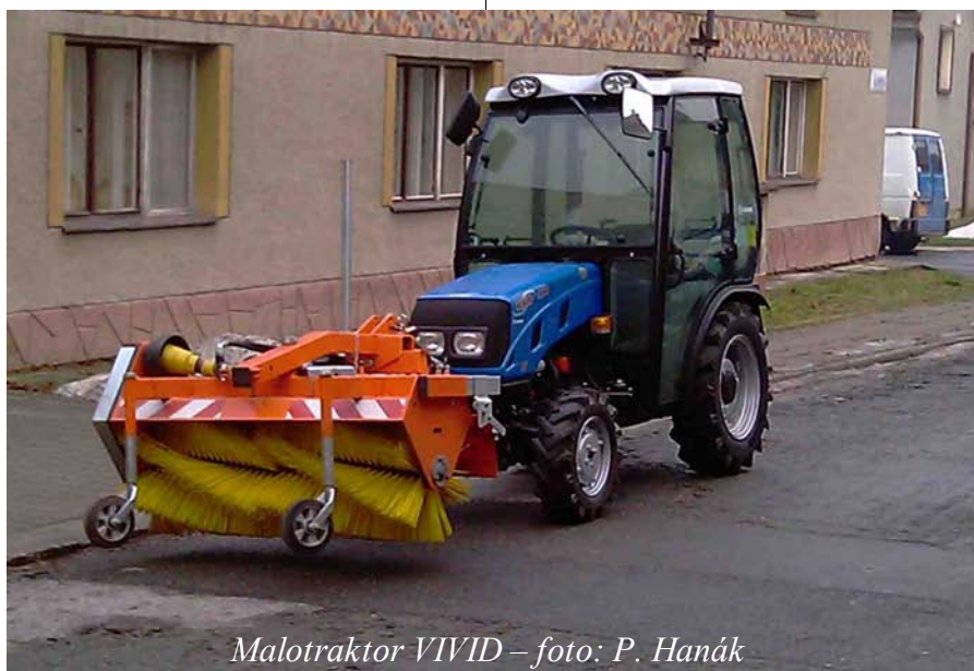
Malotraktor VIVID

Od 15. dubna se v naší obci zahajuje svoz a likvidace bioodpadu . Jak jsme Vás již informovali, zastupitelstvo obce na lednovém zasedání schválilo svoz prostřednictvím 240 litrových BIO nádob v domácnostech s 50 % finančním příspěvkem obce. Vycházeli jsme z výsledku ankety, která byla uskutečněna na konci loňského roku. Bylo zjištěno, že občané mají větší zájem o zbavování se bioodpadu než o jeho kompostování na vlastním pozemku. Bohužel již v současné době je spousta našich spoluobčanů, kteří ukládají posečenou trávu a jiné rostlinné zbytky do popelnic na směsný odpad. Těch, kteří