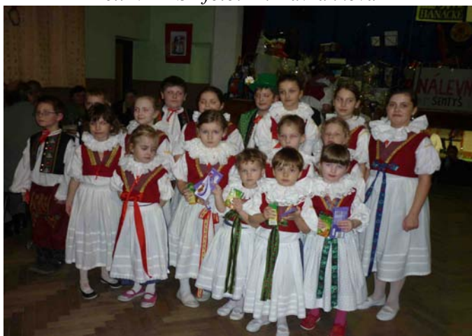
Majetínek na bále