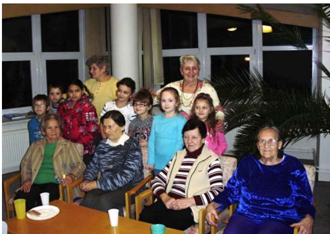
Děti v DPS