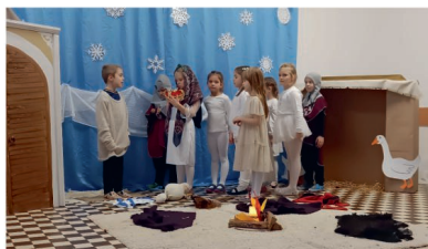
Příkrásné divadlo o svatém Martinovi v podání naší přípravy