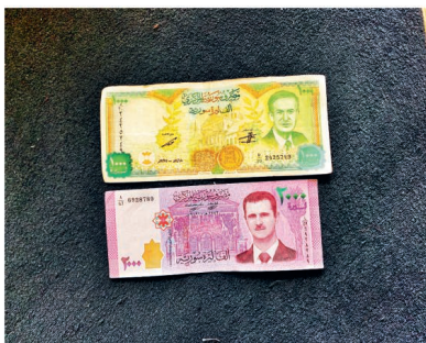
Syrské libry s obrazy Háfize a Bašara Asada již brzy platit nebudou

Opouštím tuto nádhernou horskou vesnici s otázkou nad budoucností menšin. Většinoví sunnitě (kromě Kurdů) teď slaví, křesťané mají obavy a dříve vládnoucí Alavitě mají velký strach.