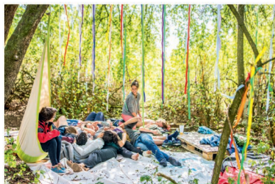
Čeká nás propojení s přírodou