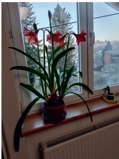
Rozkvetlá chloubka Obecního úřadu