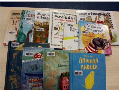
I děti si u nás vždycky přijdou na své