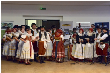
Příprava na slavnostní nástup souborů

Slavnostní zahájení zpestřily písně v podání Národopisného souboru Týnecáci z Velkého Týnce. Poté následoval slavnostní nástup souborů a předvedení Moravské besedy – tradičního moravského pásma písní a tanců, při kterém tanečníci v krojích vytvářejí nádherné obrazy.