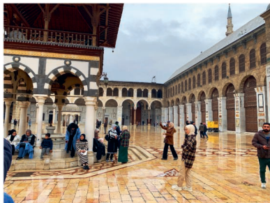
Momentka uvnitř Umajjovské mešity v centru Damašku