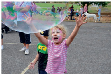
Na festivalu bude bohatý program pro děti i celé rodiny