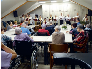
Soubor MÍR v aktuálním složení