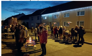
Příjemné setkání a poklábosení u stromečku