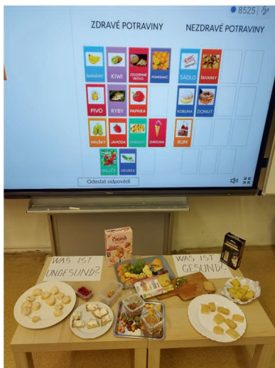
Výuka o zdravé výživě bohatě propojená s němčinou. Jen tak dál