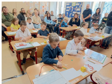
Pilní prvňáčci a jejich hrdí rodiče