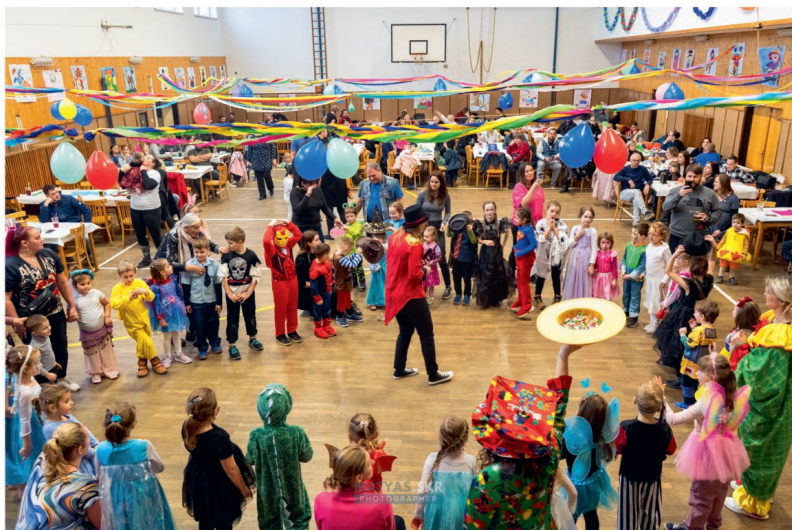
Děti soutěžily o stožesť a odměnou jim byly kokinka. Kdo by to nebral