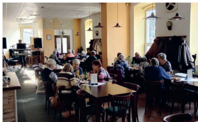
Kokorští senioři v družných rozhovorech