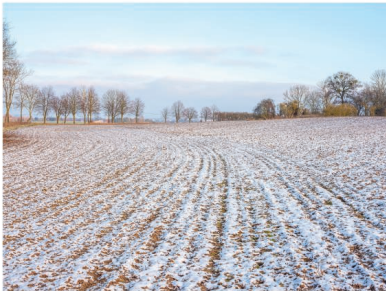
Na polích ležel letný sněhový poprašek