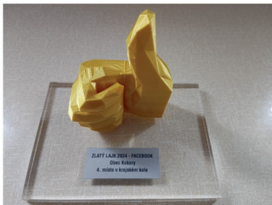
Zlatý lajk už má své čestné místo na policiče

Díky pravidelným příspěvkům obecního úřadu mají obyvatelé neustálý přehled o dění v obci – ať už jde o kulturní akce, změny v dopravě, informace o odpadech nebo důležité úřední novinky. Navíc se zde často objevují fotografie a reportáže z místních událostí, které přibližují atmosféru našeho života v Kokorách.