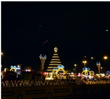
Vánoční výzdoba v Damašku