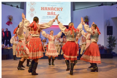
Hanáci, Hanáčky i přespolní tancovali až do pozdních nočních hodin

Na bále se šlo přibližně 500 Hanaček, Hanáků, jejich příznivců a dalších návštěvníků, kteří si užili večer plný hudby, tance a skvělé atmosféry. U vstupu byli všichni návštěvníci přivítáni tradiční hanáckou pohostinností – štamprlíčkou hruškovice a hanáckým koláčkem. K dispozici bylo bohaté občerstvení, včetně zabijačkových a tvarůžkových specialit, které neodmyslitelně patří k hanácké kuchyni.