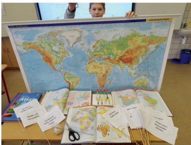
Bohatá příprava na práci s měřítkem mapy