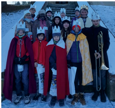
Kokorští Tři králové 2025

Letos bylo pro koledu opravdu příhodné počasí. Sníh se držel jen na trávnících, nepršelo (jako vloni), bylo slunečno, suché chodníky a teplota mírně pod nulou. V regionu Charity Přerov bylo letos vybráno do 266 kasiček 1.707.349,- Kč. Včetně darů zaslaných on-line je celkem 1.751.239,- Kč. V celé olomoucké arcidiecézi koledníci letos vykoledovali 43.920.606,- Kč a v celé České republice účtyhodných 182.125.671,- Kč.