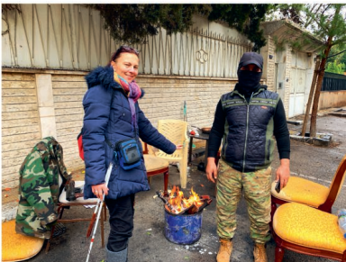
Na požádání dovolil bojovník Hajjat Tahrir aš-Šám společnou fotografii

Právě Bašár Asad nechal propustit ze svých věznic ty nejkrutější džihádisty, aby mu pomohly v boji s protiasadovskou opozicí. Zhruba v roce 2018 získal Bašár al-Asad zpět většinu syrského území, kromě malé oblasti Idlib na severozápadě země, kam většina sunnitských teroristů odešla.