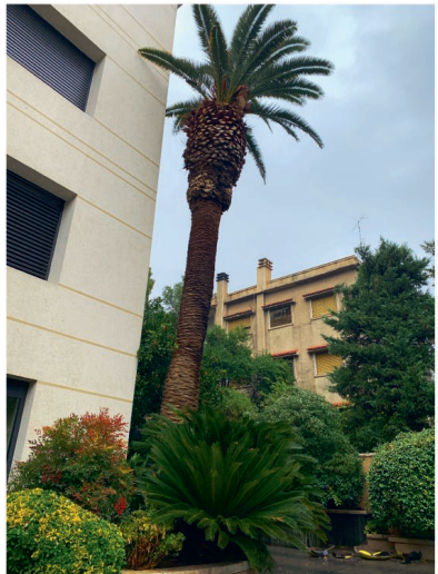
Získala jsem povolení navštívit palác bývalého diktátora Bašára al-Asada