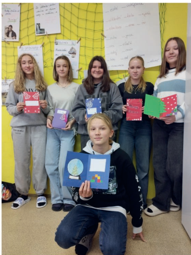
Mladí tvůrci anglických blahopřání