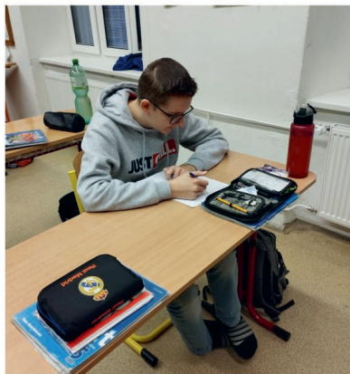
Jeden z úspěšných řešitelů olympiády