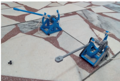
Katapulty aneb fyzika s fyzikem v praxi