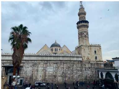
Pohled na Umajjovskou mešitu v centru Damašku

Dokonce i v křesťanské čtvrti Hamedi je veselo, hraje hlasitá hudba, bez problému se tu dá sehnat libanonské pivo nebo syrské víno. Láhev vychází na 100 Kč. Damašek je prý nejstarším obydleným místem naší planety. Zda je to pravda netuším, mezi ta nejstarší ale určitě patří. Srdcem města je obrovská Umajjovská mešita, u které se ztrácím v davu spokojených lidí.