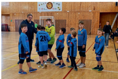
Oslabené družstvo mladších žáků s posilou z přípravy