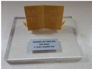
Krásné ocenění našich novin

Podle hodnocení poroty jsou Kokorské noviny kvalitní a čtivé, přinášejí pestrou paletu témat – od důležitých informací z úřadu, přes kulturní a sportovní dění, až po historické a vzdělávací články. Velkou pochvalu získal výběr témat, jazyková úroveň a srozumitelnost textů. Porota ocenila také to, že zpravodaj pokrývá nejen úřední informace, ale také dění v místních spolecích, sportovních klubech a vzdělávacích institucích.