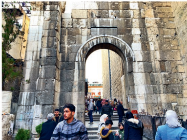
Ulice starého Damašku jsou plné lidí

Dříve honosný palác diktátorů Asadových nebyl v minulosti pro veřejnost přístupný. Vstup je dnes obehnaný jednoduchým řetězem, uvnitř zcela vyrabovaný, křišťálové lustry, perské koberce i drahý nábytek jsou ukradeny. Přežila jen zelená zahrada. Poprosím o fotku jednoho z bojovníků HTS, který si právě ohřívá čaj na ohýnku na chodníku přímo před palácem. V historickém centru Damašku procházíme starým bazarem, který je plný nadšených lidí. Všichni se usmívají a živě diskutují o pádu diktátora Asada, který jejich zemi uvedl do hluboké krize s vysokou inflací. Arabsky sice nerozumím, všude neustále slyším srovnávání Asad - Sara.