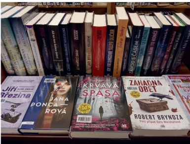
Kníží nálož pro dospělé

Naše knihovna je otevřena každou středu od 15 do 18 hodin a každý pátek od 9 do 12 hodin. Roční poplatek za půjčování činí 50 Kč pro čtenáře od 15 let, 25 Kč pro děti od 6 do 15 let, děti do 6 let mají půjčování zdarma. Srdečně zveme všechny milovníky knih a literatury, aby nás navštívili. Těšíme se na vaši návštěvu! K.V.