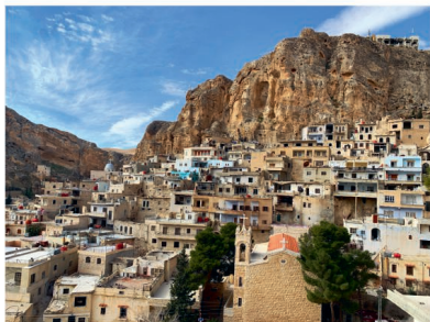
Vesnice Malúla se nachází na vrcholku vysokých hor

Stačí ale popojet 60 km severně od Damašku a ocítáte se v Malúle, převážně křesťanské vesnici a vyhlášeném poutním místě. Dříve velmi živé místo je dnes strašidelně pusté. Křesťané z důvodů bezpečnosti spolupracovali s Asadovým režimem, který nad nimi držel ochrannou ruku. Tuto jistotu však ztratili a mají strach. Téměř všechny rodiny proto utekly do Damašku, kde se cítí bezpečněji.