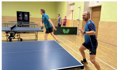
Smeč starostky obce