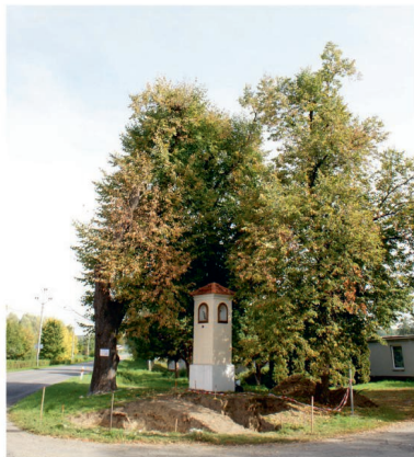
Náves v Majetíně

Otázka, jak poškození vzniklo, přivedla odborníky k historickým pramenům, které ukazují, že vojáci do první poloviny 19. století používali zuby k otevírání prachových nábojů. Vojáci museli náboje doslova trhat zuby, aby oddělili část náboje se střelným prachem od kule. „Voják si opakovanou činností zuby oslabil a následkem tohoto stresu mohlo dojít i k zlomení korunek zubů,“ popsal Šín. I když jsou zmínky o praxi zaznamenány v historických pramenech, fyzický důkaz vědci postrádali. Voják z Majetína se stal jedinečným případem, který nese viditelné stopy po opakovaném mechanickém oddělování prachových nábojů.