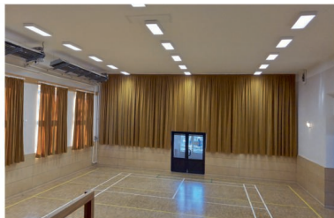
Sokolovna po rekonstrukci

V sokolovně jsme úspěšně dokončili rekonstrukci, která zahrnovala nové LED osvětlení, odvlhčení sklepa a instalaci akustických závěsů ve zlaté barvě. Nové osvětlení od firmy Modus s intenzitou až 500 lx umožňuje regulaci šesti vypínači a zahrnuje tři řady stropních a čtyři boční LED svítidla s nízkou intenzitou pro různé akce. Stropní LED zářivky (celkem 21 ks) mají nerozbitný polykarbonátový kryt, vhodný pro míčové hry. Odvlhčení sklepa proběhlo pomocí injektáže hydrostrukturální pryskyřicí, následně byla aplikována hydroizolační stěrka, sanační omítka a protiplišňová malba.