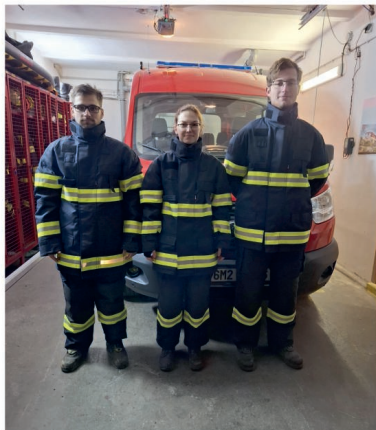
Nové vícevrstvé zásahové obleky

Jednotka SDH obce Majetín je zařazena do kategorie JPO V. V roce 2024 měla 12 členů a podílela se mimo jiné na údržbě svěřené techniky, věcných prostředků požární ochrany a osobních pomůcek. Obec poříдила další tři kusy vícevrstvých zásahových obleků, takže nyní jimi disponuje již devět členů jednotky.