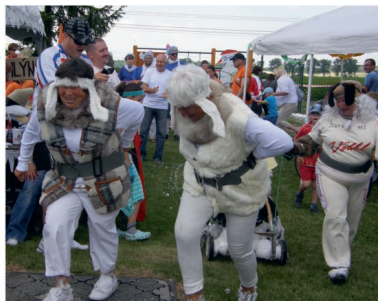
I. zimní olympijské hry

Věřím, že všechny plánované akce v naší obci budou úspěšné. Dovolím si zmínit alespoň tradiční Kácení máje , které se uskuteční v sobotu 31. května, tentokrát na téma II. zimní olympijské hry . Letos uplyne již 20 let od prvního Kácení máje, kdy mezi sebou soutěžili zástupci ulic – tehdy na téma I. olympijské hry. Protože jsme si letos zimních radovánek příliš neužili, pokusíme se to alespoň symbolicky vynahradiť. Zároveň si zavzpomínáme na I. zimní olympijské hry v naší obci, které proběhly v rámci Kácení máje v roce 2011.