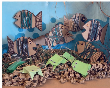
Výtvarná soutěž na téma „Rybíčka malička aneb život u rybníka“

Ve středu 19. března ožil zámek v Citově setkáním přibližně 50 návštěvníků, mezi nimiž nechyběly oceněné děti z mateřských a základních škol mikroregionu Království. Výtvarná soutěž Galerie na zámku nesla téma „Rybíčka malička aneb život u rybníka“, které inspirovalo malé umělce k tvorbě jedinečných děl. Výstava jejich prací byla pro veřejnost otevřena i v následujícím týdnu.