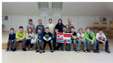
Valentýnská pošta a Laskavec

Nechyběla Valentýnská pošta v rámci Hrdé školy, jejíž akcí se pravidelně účastníme několikrát ročně. Síla souměřitosti, hrdoosti a nových zážitků, posilování vztahů, to jsou krásné benefity tohoto projektu, který je součástí Schools United.