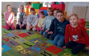
Turistický kroužek na návštěvě Muzea Komenského

Turistický kroužek byl na návštěvě Muzea Komenského s bohatým programem, také si zahráli bowling v Předmostí.