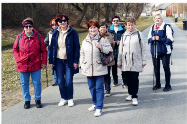
Senioři – Chodíme pro mozek a pro radost