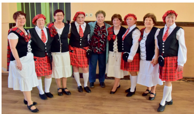
Báječný ženský na vystoupení v Brodce u Přerova

Country skupina Báječný ženský (průměrný věk 78 let) zahájila nový rok 2025 návštěvou nového tance. Scházíme se každý čtvrtek, při tanci zapomeneme na všechno, co nás bolí a trápi.