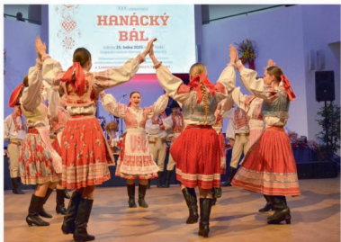
Hosté – folklorní soubor Dunajec