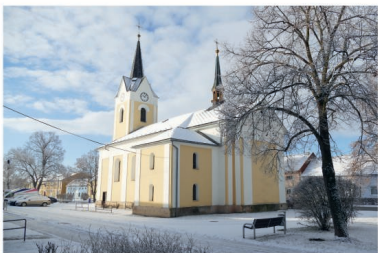
Letošní první sníh 3. ledna