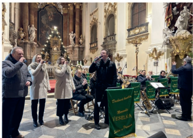
Vánoční koncert mikroregionu Království

N a 2. svátek vánoční uspořádal mikroregion Království v Dubě nad Moravou Vánoční koncert v Poutním chrámu Očišťování Panny Marie. Vystoupila dechová kapela Moravská Veselka, která zahrála tradiční koledy i oblíbené melodie. Nádherné prostředí barokního chrámu umocnilo sváteční atmosféru. Akce se stala krásným zakončením vánočních svátků a příležitostí ke společnému setkání obyvatel mikroregionu.