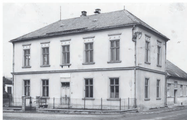
Majetínská škola – historická fotografie