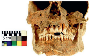
Poškození dentice, zdroj: Archeologické centrum Olomouc

„Jedná se o unikátní objev, který nám poskytuje první fyzický důkaz o vojenské praxi otevírání nábojů zuby a její důsledky na zubní aparát vojáka. Ojedinelé trauma nám umožnilo odhalit profesi muže pohřbeného v Majetíně,“ uzavřel Šín. Tento náález otevírá nové možnosti pro výzkum vojenské historie a fyzických dopadů na život vojáka. Kosterní pozůstatky vojáka jsou nyní uloženy v depozitáři Archeologického centra Olomouc a výsledky tohoto dlouholetého výzkumu byly publikovány ve vědeckých časopisech.