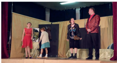
Divadelní soubor P.O.KRO.K.

Abychom si zkrátili dlouhé čekání na příchod jara, zpestřili jsme si první jarní den divadelním představením v místní sokolovně. Zavítal k nám divadelní soubor P.O.KRO.K. , který nás svým humorným pojetím hry Isabelino procvotí aneb LIFE after EFIL nejen pobavil, ale také přiměl k zamyšlení.