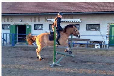
Konici – tréninkové odpoledne