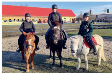
Konici – tréninkové odpoledne

J aro se už blíží, a věřte nebo ne, my se už moc těšíme! Nejen my, ale i naši koniči. Dny se už prodlužují a tráva se pomalu začíná zelenat, i toho sluníčka se snad brzy dočkáme. Každé roční období má své kouzlo. Ale jaro je prostě nejkrásnější. Třeba se mnou budete souhlasit i vy.