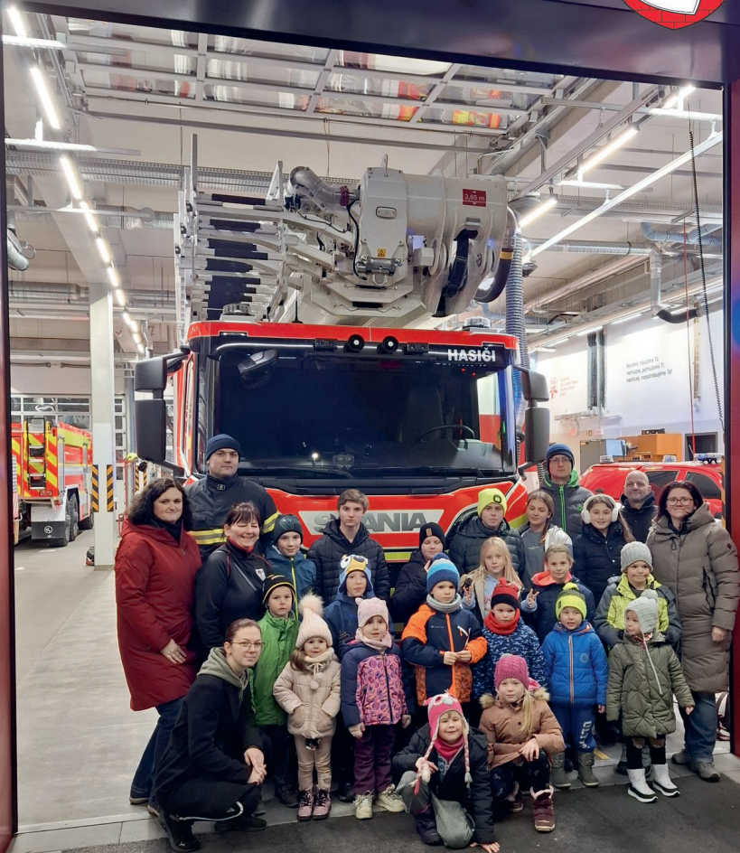
Mladí majetínští hasiči navštívili profesionály v Přerově