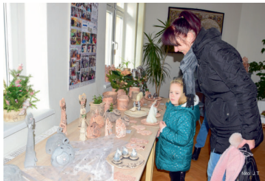
Vánoční výstava ve zvonařské dílně rodiny Dytrychových