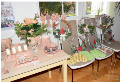
Vánoční výstava v Masarykové knihovně