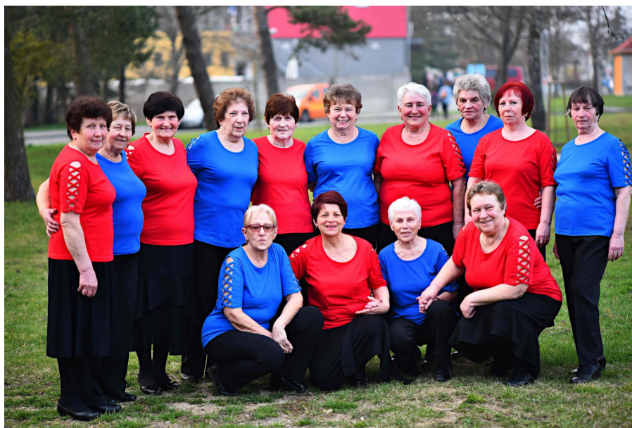
Báječný ženský na akci Království hraje, zpívá a tančí

Milí občané, za taneční skupinu "Báječný ženský", Vám přeji krásné prázdniny, plné sluníčka, příjemné koupání, prostě pěknou dovolenou.