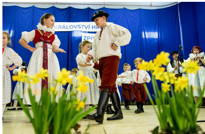
Království hraje, zpívá a tančí

Letošní rok je v obcích mikroregionu Království opět bohatý na společné kulturní a sportovní akce. V lednu byla vyhlášena fotografická soutěž Království objektivem