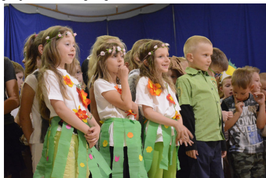
Děti na besídce ke Dni matek

Školní rok nám rychle utekl a toužebně očekávané prázdniny se kvapem blíží. Jaro nám přineslo nejenom velmi pěkné počasí, ale i spoustu akcí pro děti. Tradiční dubnovou akcí byla oslava Dne Země, kdy se děti společně zúčastnily projektu na podporu a ochranu životního prostředí. Snažily se pomoci přírodě při úklidu okolí a sbíraly vše, co do přírody nepatří.