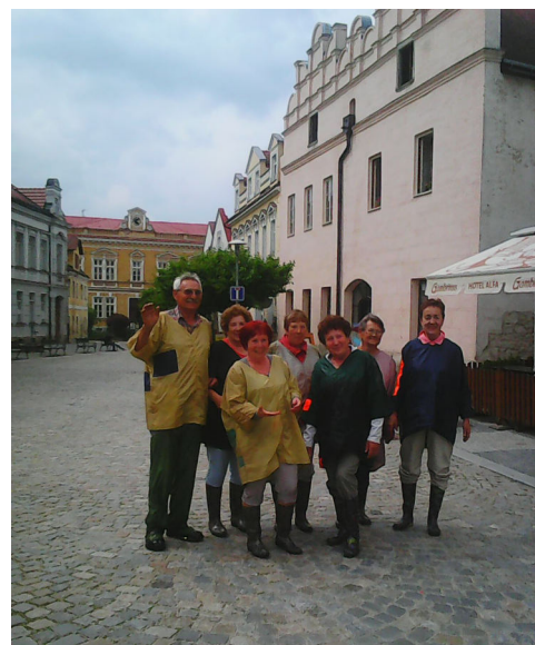
Senioři na zájezdě