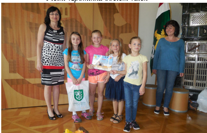
Galerie na zámku v Citově