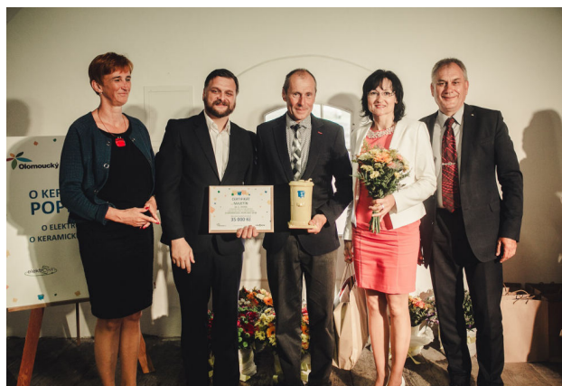
Předání ocenění O keramickou popelnicí

Do soutěže, kterou každoročně vyhlašuje Olomoucký kraj společně s Autorizovanou obalovou společností EKO-KOM, a. s., bylo zapojeno 396 obcí a měst Olomouckého kraje. V samotném klání se hodnotila vykazovaná data v systému EKO-KOM. Šlo především o množství vyříděných odpadů na jednoho obyvatele a počet tříděných komodit na území jednotlivých obcí a měst. Hodnocena byla mimo jiné i hustota sběrné sítě nebo sběr nápojových kartonů či kovových odpadů. Nedílnou součástí ocenění jsou i motivační odměny na podporu odpadového hospodářství, které obcím na medailových příčkách poskytne Olomoucký kraj. Obec Majetín byla oceněna částkou ve výši 35 000 Kč.