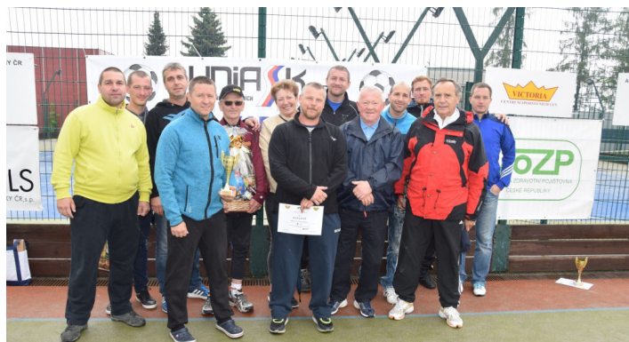
Hráči Lions s pořadateli turnaje v Liberci