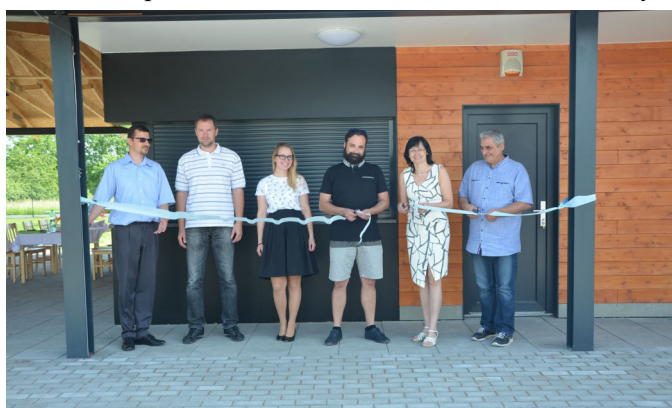
Kolaudace nové budovy v areálu ozdravného centra

postavena a 25. května 2018 zkolaudována nová budova bufetu se sociálním zázemím a posezením s přispěním dotace z Ministerstva pro místní rozvoj ve výši 1 mil. Kč, celkové náklady činily 5,6 mil. Kč. V měsíci červnu byly zahájeny stavební úpravy budovy obecního úřadu - zateplení obvodového pláště, výměna střešní krytiny, úprava hlavního vstupu a rekonstrukce kotelny. O prázdninách budou probíhat stavební úpravy v budově školy - rekonstrukce sociálního zázemí v přízemí a v 1. patře a nové WC pro učitele. V měsíci srpnu dojde k opravě účelových komunikací k železničnímu podjezdu.