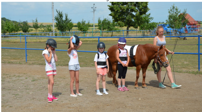
Den dětí u koní