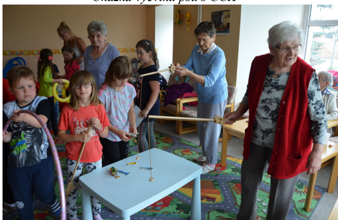
Sportovní hry v DPS