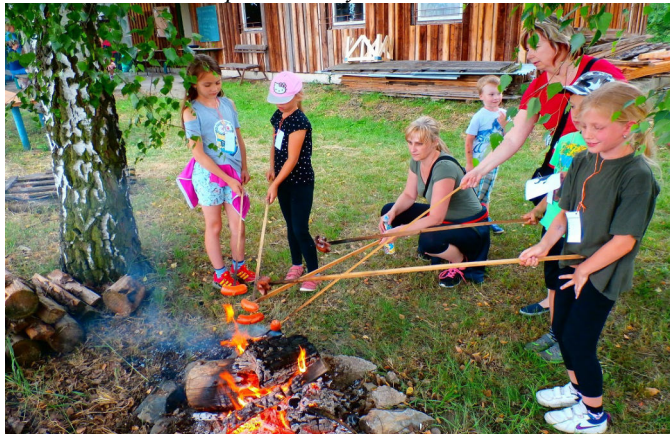
Myslivecká vycházka – opékání špekáčků