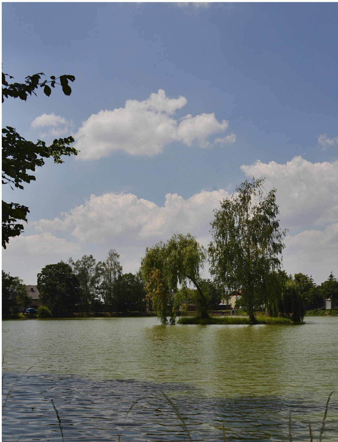
Rybník Hliník v Majetíně