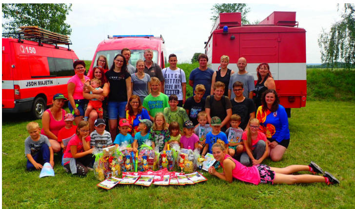
Majetiňští hasiči na soutěži v Oplocanech