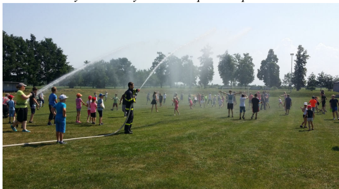
Ukázka SDH Majetín ke Dni dětí