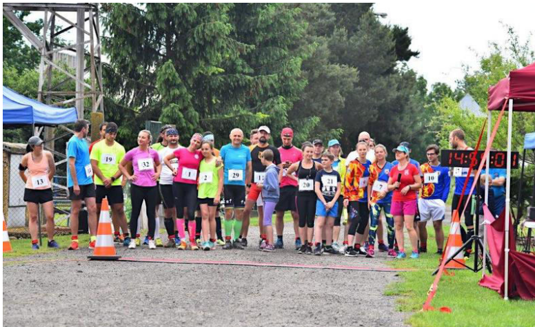
Start 3. ročníku Majetínského běhu