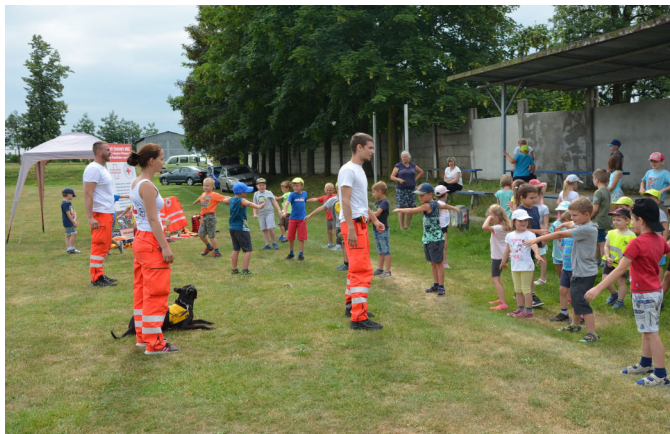
Ukázka výcviku psů s ČČK