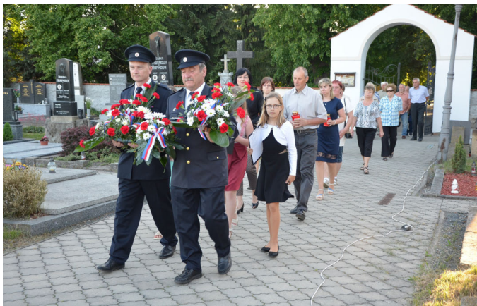
Pietní vzpomínka obětem válek