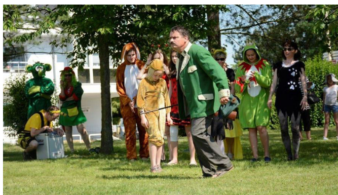
Kácení máje 2018

zazněla na živo písnička Pohoda od kapely Kabát v podání místních zpěváků. Zástupci ulic předvedli skupinu HOLKI a Lunetic, ABBU, Michala Davida, Tancování a zpívání s Míšou, kapelu Plavci, EWU FARNOU, Boba Marleyho s kapelou a skupinu Šlapeto. V roce 2017 jsme Vařili letem světem – poznali jsme chutě ruské, italské a české kuchyně. Kromě klasických pokrmů připravila každá ulice soutěže pro děti i dospělé. Téma letošního kácení Máje znělo „ Jak to bylo před 20 lety “ - zavzpomínali jsme na obnovenou tradici. U kašny děti statečně převzaly za každý rok jeden balónek. Skácení májky předcházela scénka o zvířátkách v lese snažící se uchránit májku před zlodějem, který si na májku ukryl svůj lup. Na pomoc si zavolala hajného. Hajný uznal, že strom je už starý, potřebuje skáčet a zavolal proto odborníky dřevorubce. Veselý průvod