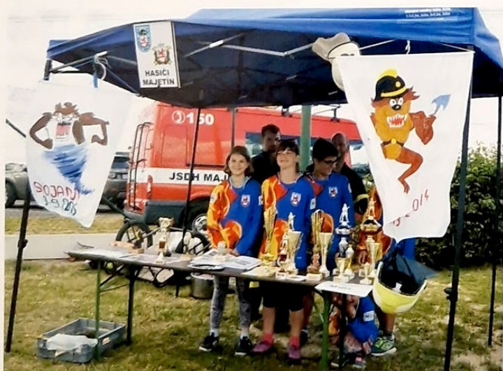
Prezentace obce v soutěži