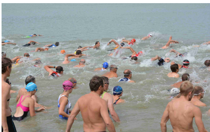
Královský triatlon - start dospělí