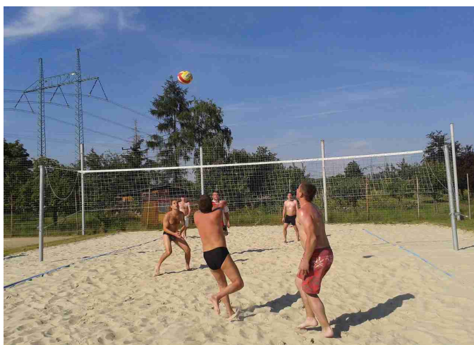
Hodový turnaj v beach volejbalu