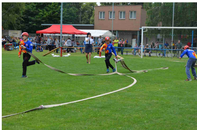
Soutěž mladých hasičů v Majetíně