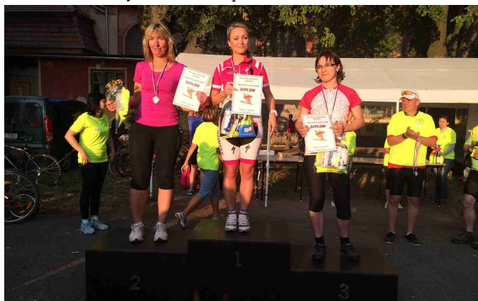
Okolo mikroregionu Dolek – kategorie ženy