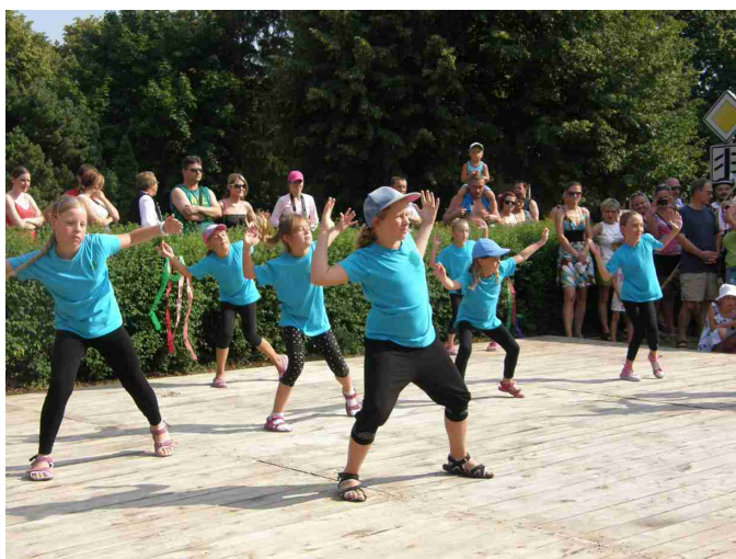
Taneční kroužek ZŠ Majetín na neckiádě