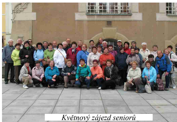
Květnový zájezd seniorů

12. – 16. 10. 2015 – počítačový kurz pro seniory