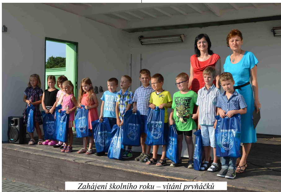
Zahájení školního roku – vítání prvňáčků