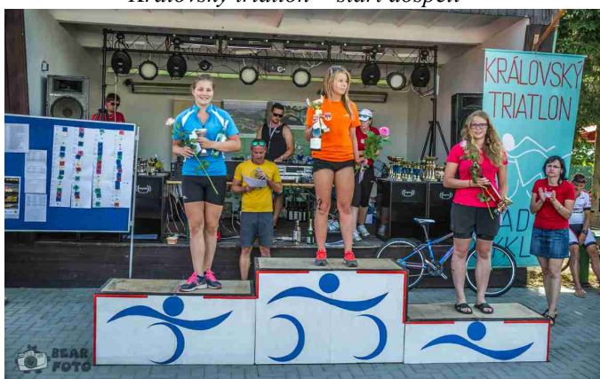
Vyhlášení kat. první triatlon v životě