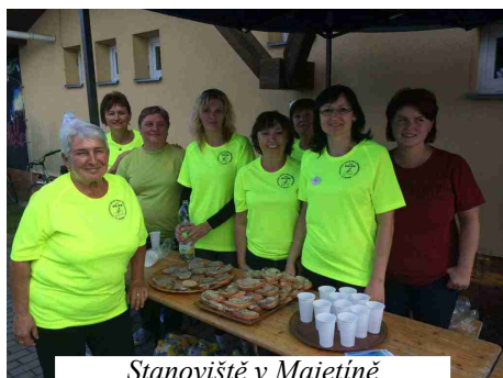
Stanoviště v Majetíně