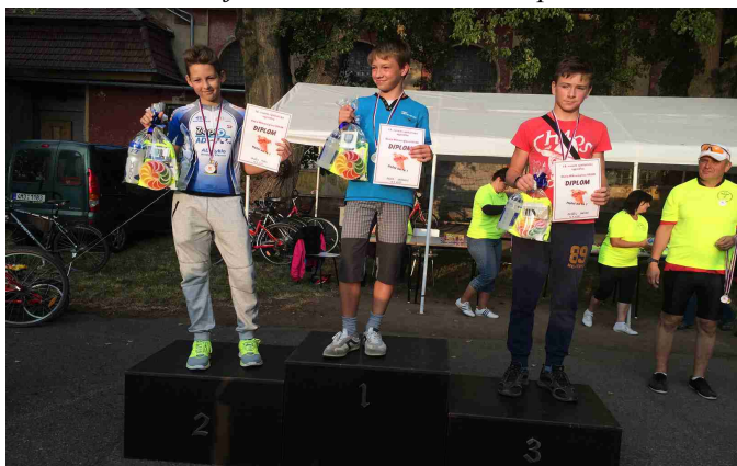
Okolo mikroregionu Dolek – kategorie st. dorost