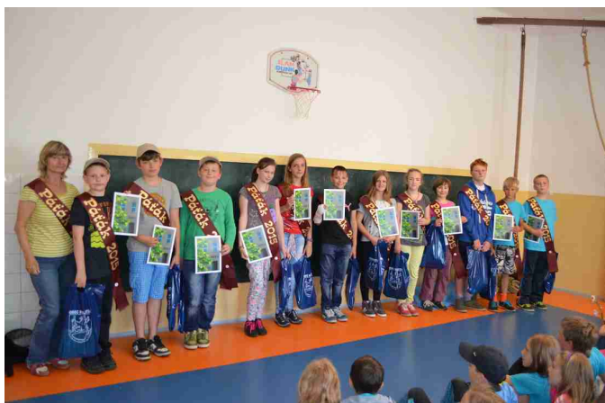
Loučení s pátáky