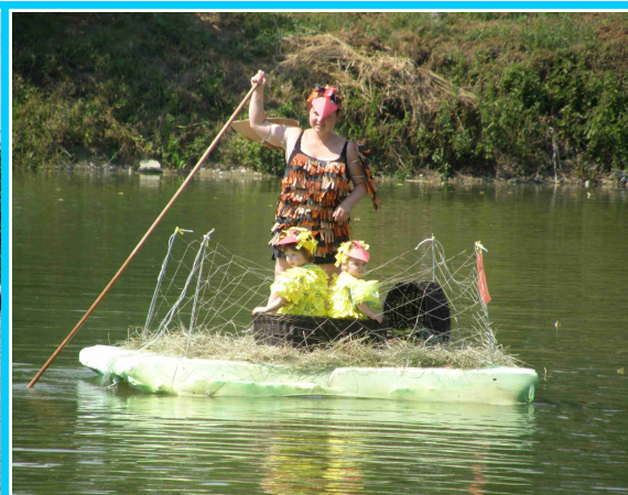
MAJETÍNSKÁ NECKIÁDA 2015