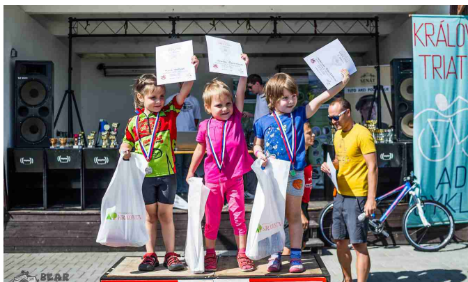
Královský triatlon - děti