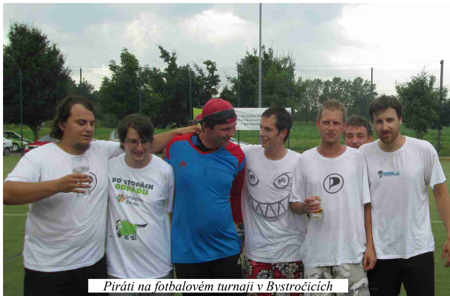
Piráti na fotbalovém turnaji v Bystročicích

Majetínští členové a příznivci místního sdružení Pirátská Tvrz se přes léto hlavně bavili. Pirátská tvrz sestavila fotbalový tým pro turnaj politických frakcí v Bystročicích, kde jsme bohužel vyhráli jediné utkání a skončili tak předposlední. Při hodových oslavách v Majetíně jsme se zúčastnili neckiády a s plavidlem "Pirátské vysílání rock'n'rollu z mezinárodních vod" jsme dokonce vyhráli první cenu od poroty. Touto cestou porotě děkujeme, a také všem, kteří se zúčastnili a především těm, kteří tuto akci organizují. Obzvlášť oceňujeme, že při následné hudební produkci jsme měli možnost slyšet autorskou kapelu (wellryba). To vyšlo výborně v kombinaci s tím, že na festivalu Kytary in Majetín naopak výjimečně hrál revival. Letos měl festival rekordní návštěvnost a děkujeme všem účastníkům této tradiční akce za vytrvalou podporu. Krom Green day revival jsme měli možnost shlédnout a poslechnout kapelu Millenium X