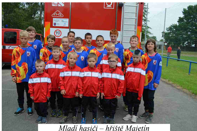
Mladí hasiči – hřiště Majetín

V letošním roce je kroužek mladých hasičů opět plný poznání, her a zábavy. V zimních měsících, kdy není moc možností venkovních aktivit, jsme se zúčastnili společně s družstvy z Brodku u Přerova, Kojetína a Tovačova florbalového turnaje v místní sokolovně. V obci Čelčice jsme závodili vůbec poprvé v uzlové štafetě „Čelčický uzel“, byla to pro nás nová zkušenost. V jarních měsících jsme již trénovali požární útok na soutěž „Plamen“ a „Olomouckou ligu mladých hasičů“. Mimo toho jsme se