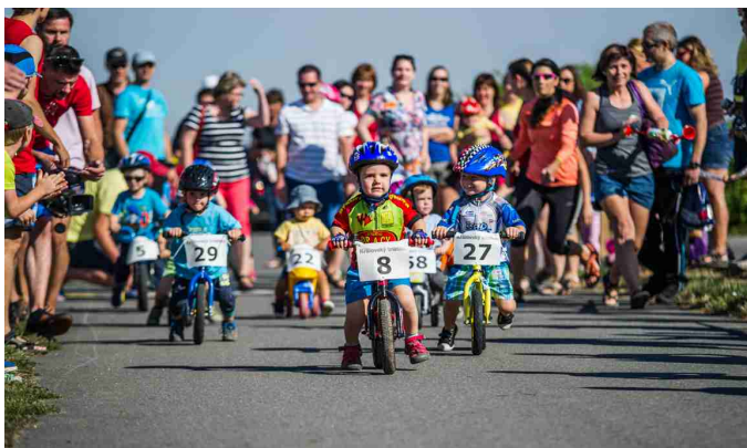
Královský triatlon - děti