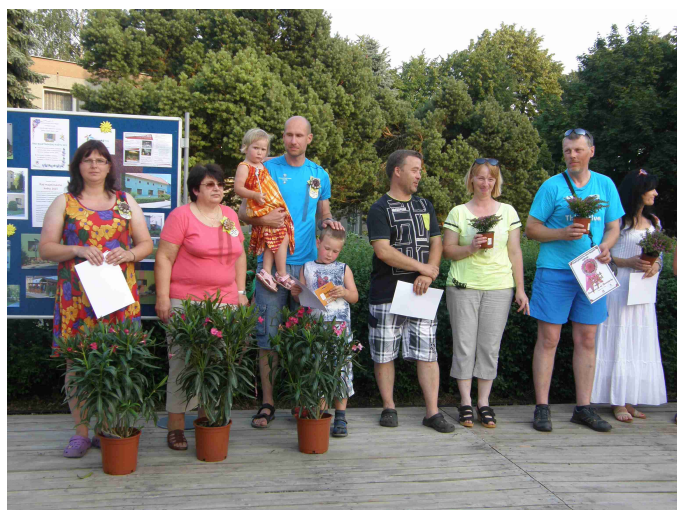
Vyhlášení výsledků soutěže Řád majetínského květu