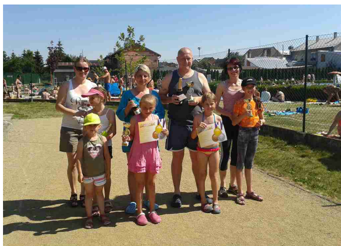
Vítězové hodového turnaje v petaque