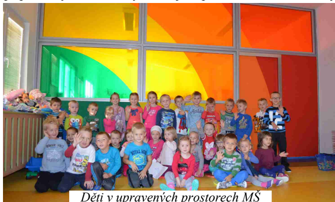
Děti v upravených prostorech MŠ

V budově školy a školky byl o prázdninách zrealizován projekt „Bezpečná a hravá ZŠ a MŠ Majetín“, na který obec získala dotaci z Ministerstva pro místní rozvoj ve výši 370 tis. Kč, celkové náklady byly ve výši 546 tis. Kč. Jednalo se například o obnovu podlahy ve vstupní chodbě školy, na schodišti a v MŠ v přízemí, byly pořízeny nové vnitřní dveře a dělící příčka. Tento projekt úzce navazoval na projekt „Stavební úpravy ZŠ a MŠ“, který řeší rekonstrukci střechy na budově školy včetně půdní vestavby s novou třídou, rekonstrukci sociálních zařízení a související opravy. Současně mělo dojít k zateplení obou budov, na což obec získala příslib dotace z Operačního fondu životního prostředí. Projekt ovšem realizován nebyl. Jelikož se jednalo o nadlimitní zakázku, prováděla výběrové řízení firma na základě smlouvy o dílo. Bohužel i přesto se ve výběrovém řízení vyskytly komplikace. Ty byly ale zjištěny až po otevření obálek a nedalo se tak výběrové řízení prodloužit a tím uskutečnit nápravu. Po konzultaci na právním oddělení Státního fondu životního prostředí bylo naší obci doporučeno výběrové řízení zrušit, poněvadž by obci hrozilo riziko uložení finanční sankce. Řešením by bylo výběrové řízení opakovat. To by ale znamenalo prodloužení termínu ukončení stavby a v tom případě by nemohl být zahájen provoz mateřské školy