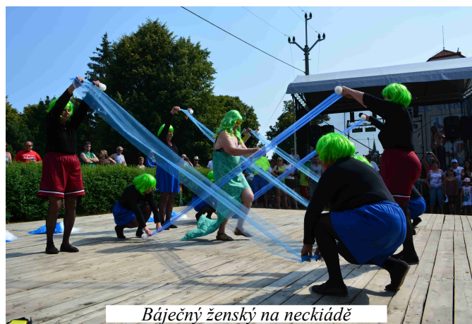
Báječný ženský na neckiádě