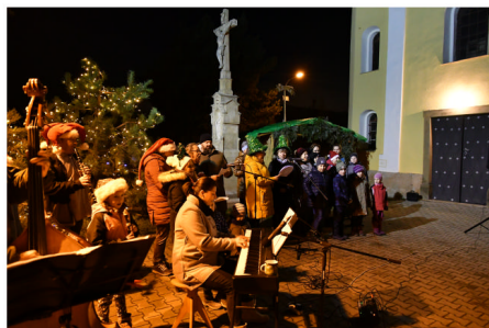
Česko zpívá koledy v Majetíně