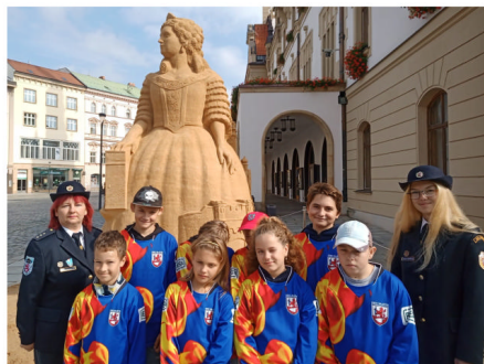
Slavnostní vyhlášení výsledků Ligy mladých hasičů

1. října proběhl v obci opět sběr vysloužilých elektrospotřebičů a starého železa. Děkujeme všem občanům, kteří se této akce zúčastnili a do sběru přispěli. Vysloužilé elektrospotřebiče lze na hasičské zbrojnici odevzdávat celoročně.