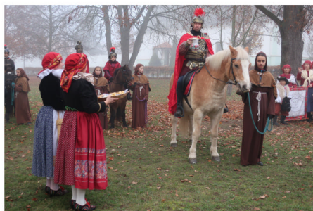
Svatomartinský průvod obcí Majetín