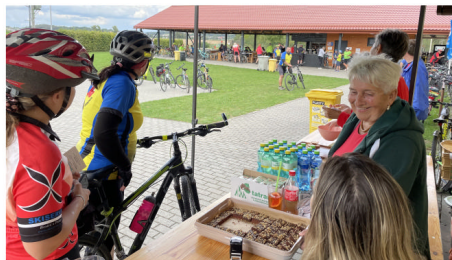
Cyklovýjížďka Dolek, stanoviště Majetín