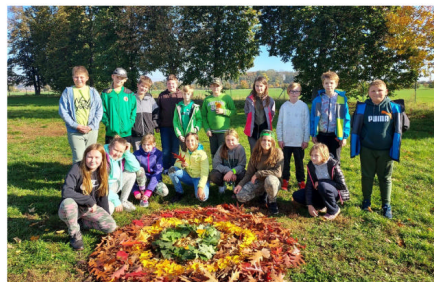
Den stromů v ZŠ