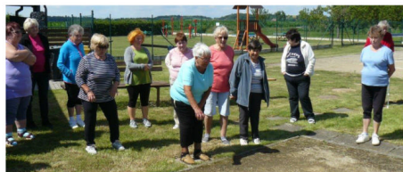
Pétanque v Majetíně