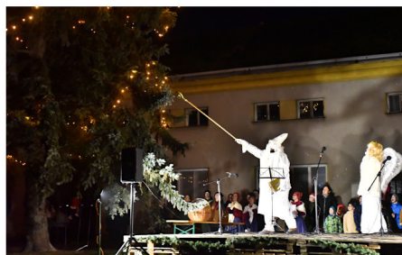
Rozsvícení vánočního stromu