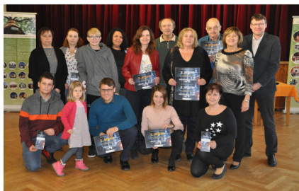
Vernisáž Království objektivem občanů Království