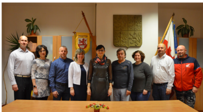
Zastupitelé obce Majetín