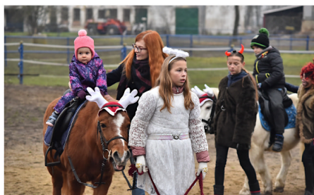
Mikuláš u koní