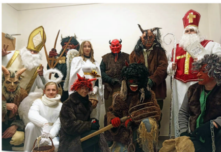
Mikuláš SK Lions