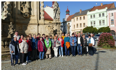
Výlet seniorů do Litovle