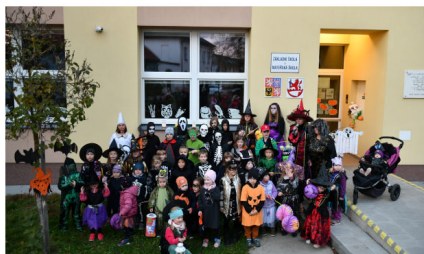
Svátek dýní a strašidel