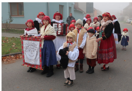
Svatomartinský průvod obcí Majetín