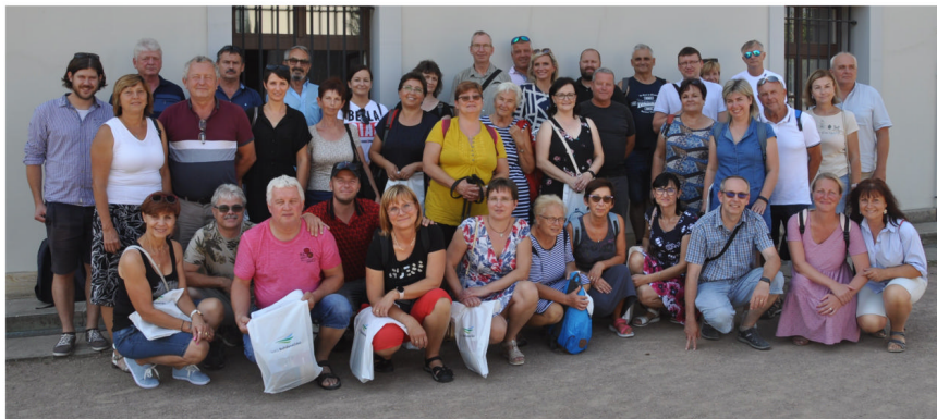
Expedice zástupců mikroregionu Království

Ve dnech 20.–21. srpna 2022 se konala v Kožušanech v areálu Za trati chovatelská výstava drobného zvířectva „VI. Krajská výstava mladých králiků a mladé drůbeže, spojená s expozicí holubů“ .