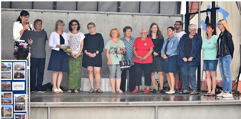
Zástupci obce a místních spolků - oslava výročí obce Majetín