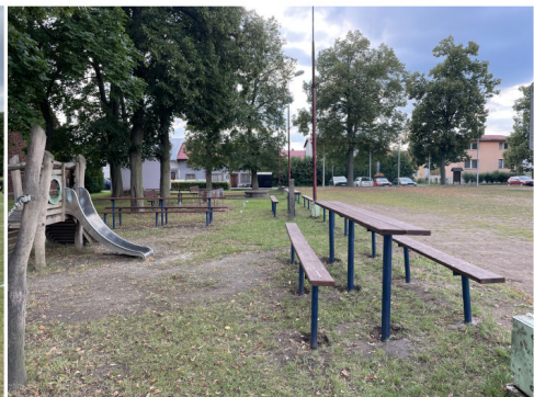
Nové lavice u sokolovny