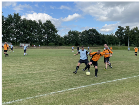
Hodové fotbalové utkání