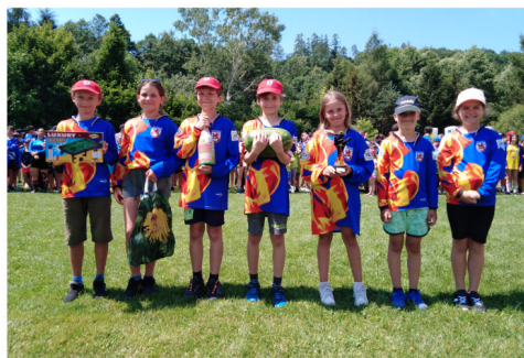
Liga hasičů - Hlubočky