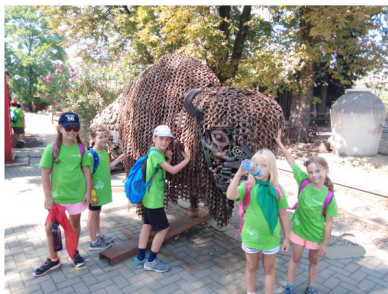
MLADÍ HASIČI NA VÝLETĚ V KOVOZOO

O prázdninách naši hasiči opět darovali krev ve FN Olomouc. Další návštěvu plánují v říjnu.