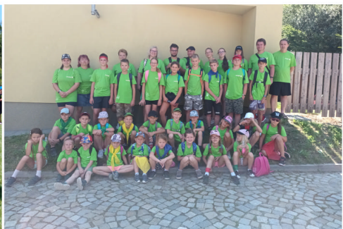
Hasiči na táboře