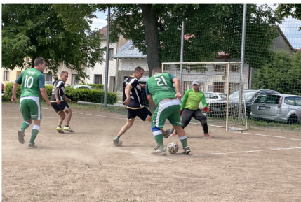
Derby SK Lions x Real material