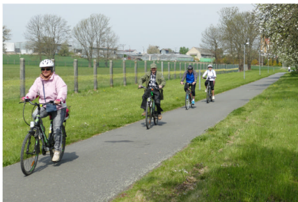
Královstvím na kole