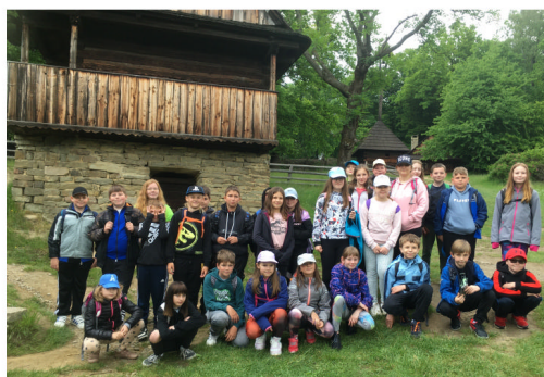
Děti ZŠ na výletě v Rožnově pod Radhoštěm

Další zajímavou akcí byla přednáška s ukázkami života dravců. Proběhla na fotbalovém hřišti a děti měly možnost si zblízka prohlédnout např. sovu, poštolku, jestřába nebo kondora.