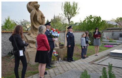
Pietní vzpomínka na hrdiny padlé ve sv. válkách

Sobota 14. května patřila v naší obci oslavě 130 let SDH Majetín . Dopoledne proběhly ukázky profesionální techniky a zásahů Hasičského záchranného sboru Olomouckého kraje a také místní