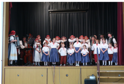
Majetínek na akci Království hraje, zpívá a tančí