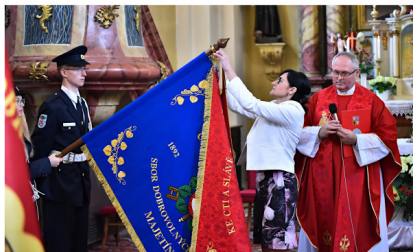
Předání pamětní stuhky ke 130. výročí SDH