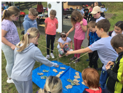
Školní výlet 2022 Rožnov pod Radhoštěm