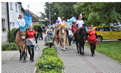
Průvod na kácení máje

Děti dostaly díky našim sponzorům spoustu dáreků, nějakou