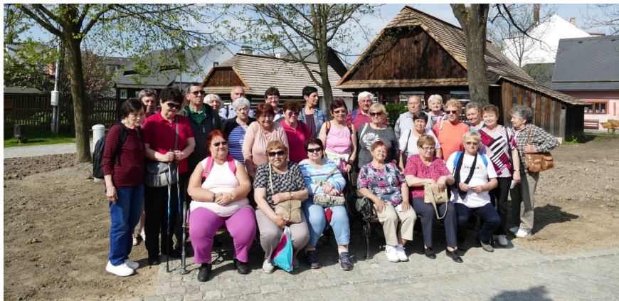
Výlet seniorů do Hlinska (skanzen Betlém)

Končí první polovina roku, čím dál více pocítujeme štěstí a radost z nastupujících teplých slunečních dnů, ale také ustupující pandemie Covidu. Je to také čas, kdy si uvědomujeme, co se nám podařilo, ale také co jsme doposud nedotáhli.