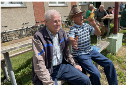
Povzbuzující diváčí derby