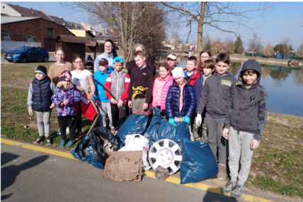
Hasiči na brigádě Společně za krásnější Majetín