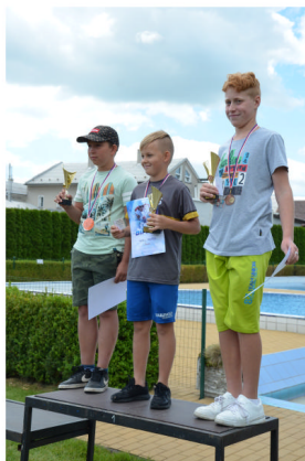
Vítězové plavecké olympiády

Přejí vám krásné prázdniny a těším se na setkání na společných akcích.