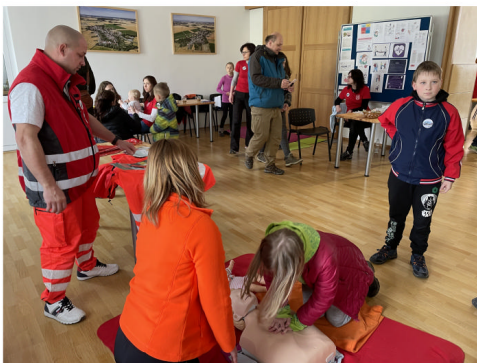
Společně - bezpečně

Tematická skupina „Vzdělávací aktivity“, která se zabývá plánováním aktivit v Komunitním centru a vzdělávacím akcím, o které občané Majetína projeví zájem, nyní finišuje s přípravou kurzu anglického jazyka pro seniory - začátečníky. O podrobnostech budete včas informováni prostřednictvím webových a facebookových