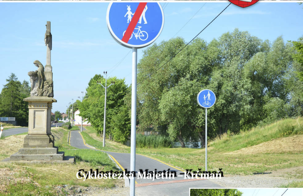
Cyklostezka Majetín – Krčmaň