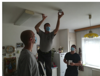
Montáž detektorů kouře v DPS

Zásahová činnost se v roce 2020 výrazně zvýšila. Jednotka měla 32 zásahů, z toho 3 požáry, 6 ostatních událostí (asistence při plesech, Královském triatlonu apod.) a 23 technických událostí (likvidace obtížného hmyzu, upevňování plechů ze střeš, protipovodňová opatření – pytlování písků, čerpání vody po přivalovém dešti). Jednotka byla povolána k odstraňování následků přivalového deště do sousedního městyse Brodka u Prerova, kde prováděla celkem 16 čerpání ze sklepů a odstraňování vodní hladiny u soukromého zemědělce (záchrana krmení pro dobytek). Byla nasazena veškerá technika a veškeré prostředky (čerpadla, centrála) ve výbavě jednotky a vše pracovalo bez problémů.