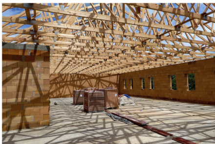
Výstavba Komunitního centra