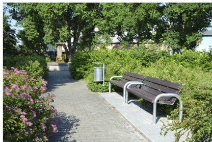
Nový mobiliář v obci

okrasného trvalkového záhonu a 1 ks solitérního keře (vřilín virginský) a obnovení travní porost.