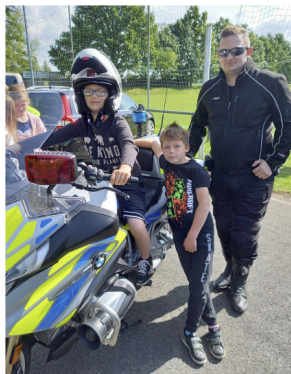
Den s policií

Po uvolnění mimořádných opatření byl v MŠ projektový den s názvem Den s myslivci, kterého se zúčastnily starší děti z oddělení Berušek. Dozvěděly se, jak se myslivci starají o zvířátka v lese, pozorovaly rozdíly mezi jednotlivými lesními zvířátky, která jim myslivci přinesli ukázat – trofeje. Vyzkoušely si některé z nástrojů, které se používají při honu (vábničky, dalekohled). Na závěr si děti opékaly špekáčky. Koncem června čeká mateřskou školu ještě jeden, a to poslední projektový den s názvem