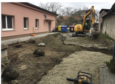
Stavební úpravy ve dvoře OÚ