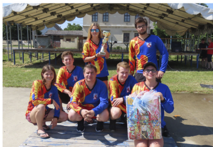
1. místo v okresní soutěži

29. května se v Olomouci konalo Okresní kolo dorostu hry