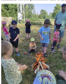
Den s myslivci

Školní rok se nám pomalu blíží ke konci a už brzy nás čekají letní prázdniny. Pojdme se poohlédnout zpět a připomenout si poslední čtvrtletí tohoto školního roku. Na základě usnesení vlády České republiky o přijetí krizového opatření byla zakázána osobní přítomnost dětí a žáků ve školách. Od 1. března se uzavřela mateřská i základní škola. U předškolních dětí