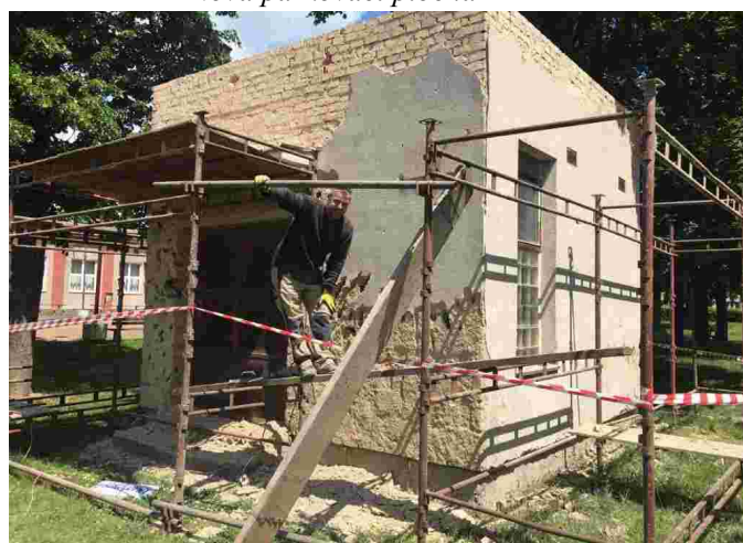
Rekonstrukce budovy zázemí na sokolovně