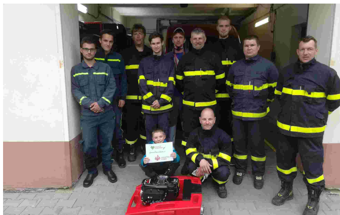
Jednotka SDH obce s novým plovoucím čerpadlem

Na výstavbu cyklostezky Majetín–Krčmaň poskytl Olomoucký kraj dotaci ve výši 1 784 300 Kč, ale vzhledem k celkovým předpokládaným výdajům 21 000 000 Kč a nezískání dotace ze Státního fondu dopravní infrastruktury ve výši 16 581 000 Kč nemůže být stavba v letošním roce realizována.