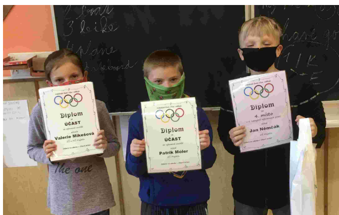
Ocenění žáci soutěže Galerie na zámku v Citově