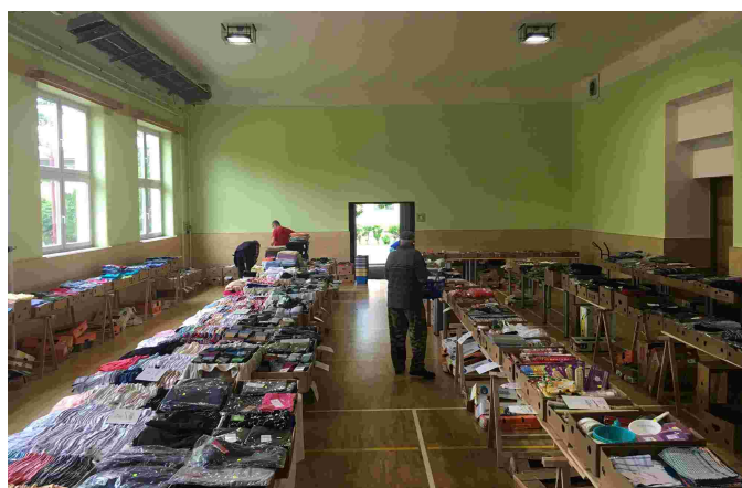
Prodej v místní sokolovně