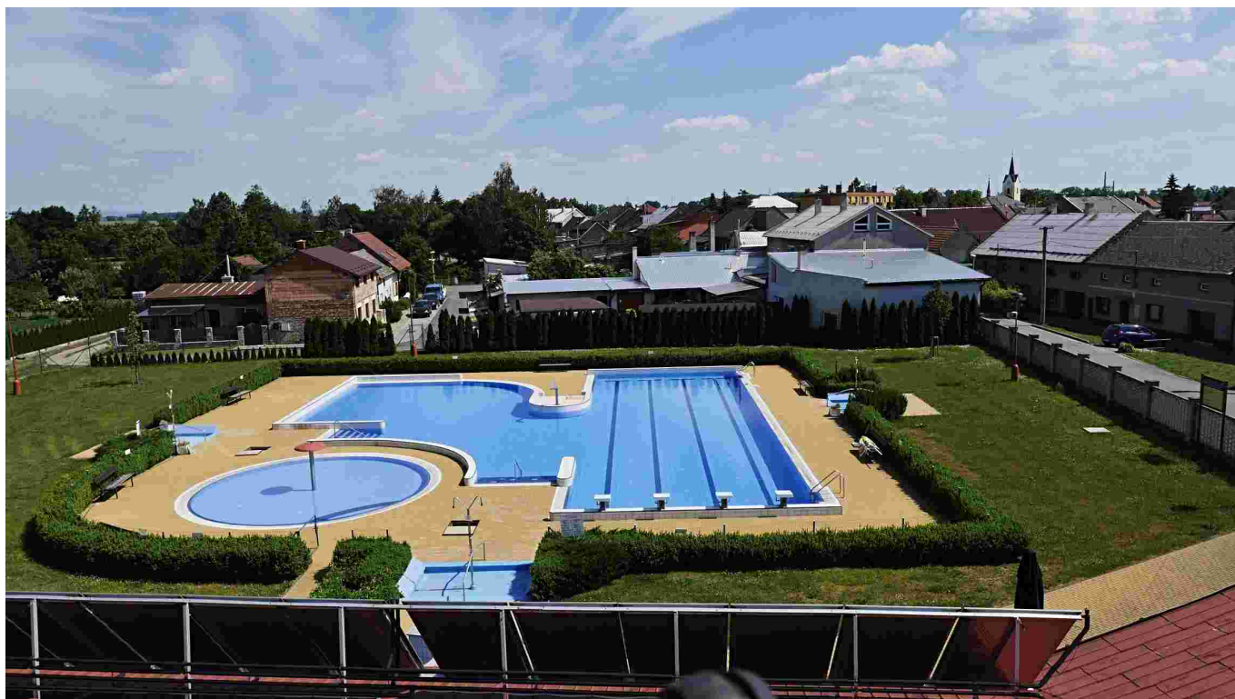
Ozdravné centrum Majetín