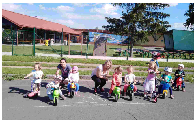
Sportovní odpoledne RC Lviček