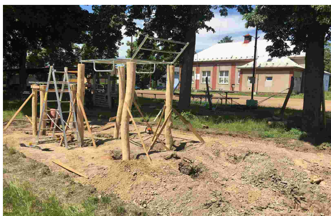
Výstavba workoutových prvků na sokolovně