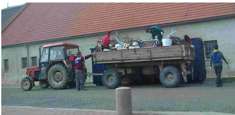
Sběr železného šrotu

Jak dobře víme, v březnu se nám všem velmi změnil dosavadní život. S příchodem koronavirové hrozby byl v celém státě vyhlášen nouzový stav a s ním spojený zákaz shromažďování. Pro sportovní družstva, ať dospělých tak dětí, to znamenalo nemalý zásah do jejich činnosti. Byly zrušeny veškeré soutěže, tréninky a jiné aktivity. Např. se v Majetíně neuskutečnila Okrsková soutěž plánovaná na konec dubna, ani Dětský den plánovaný na začátek června. První soutěž, na kterou se všichni těšíme, by se měla uskutečnit 27. 6. 2020. Bude to již tradiční majetínská Pohárová soutěž pro děti i dospělé.