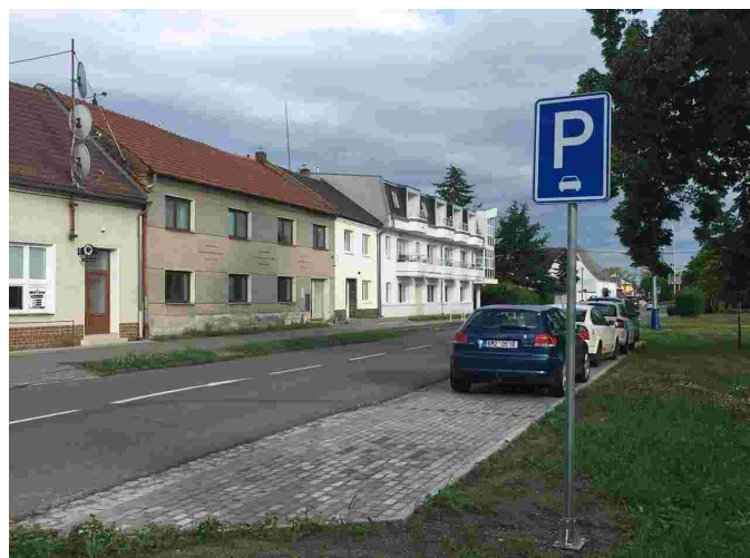
Nová parkovací plocha