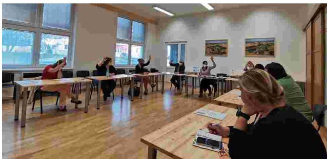
Zasedání v sokolovně

Na čistírně odpadních vod v Majetíně byla dokončena 2. etapa rekonstrukce, a to strojní části, kterou realizovala firma FORTEX – AGS, a. s. za cenu 496 000 Kč (méněpráce činily 71 000 Kč).