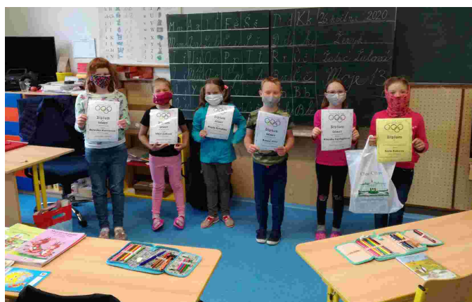
Ocenění žáci soutěže Galerie na zámku v Citově