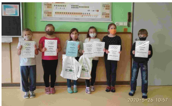
Ocenění žáci soutěže Galerie na zámku v Citově