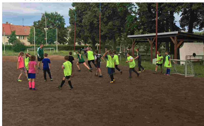
Trénink žáků SK Lions Majetín