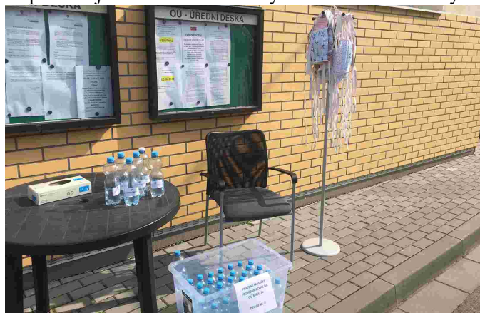
Výdejní místo roušek a dezinfekce

Připravili jsme leták s důležitými telefonními čísly a