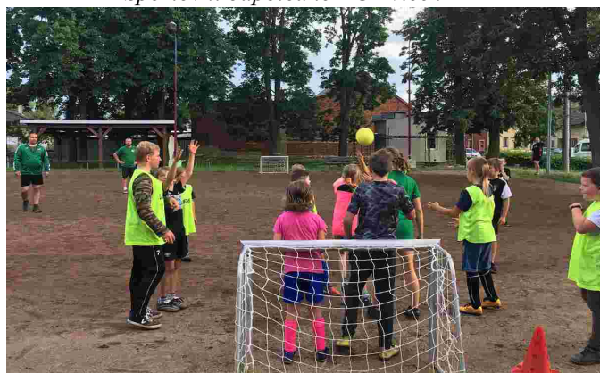
Trénink žáků SK Lions Majetín