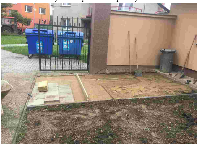
Úprava dvorku v MŠ