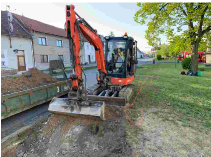
Výstavba parkovací plochy