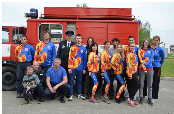
SDH Majetín na okrskové soutěži

Proběhla Okrsková soutěž, kde se muži i ženy umístili na pěkném druhém místě. V květnu jsme navštívili Rataje na jejich Zlaté Proudnicí, kde při netradičním útoku pánové obsadili 5. místo. Všechna sportovní družstva se vydala 8. 6. 2019 na Oplocekej Kopeček. Naše ženy se umístily čtvrté, muži byli třetí, veteráni druzí a jednotka na místě sedmém. Dětem se moc nevedlo a dovezly páté, sedmé a osmé místo. Členové SDH Majetín se ovšem pouze neúčastní závodů, ale také spolupřáteli dětský den na místním hřišti a pravidelně pořádají sběry železa a vyřazeného elektra, které by nemohli dělat bez přispění vás všech. Proto vám touto cestou děkujeme za vaše příspěvky. Další sběry budou probíhat v září a říjnu. Děkujeme také všem, kteří nám drží palce a podporují nás i naše mladé hasiče. Rádi vás uvidíme na některé z našich akcí.