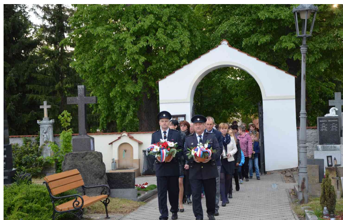
Pietní vzpomínka na padlé hrdiny v 1. a 2. sv. válce