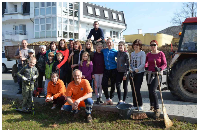
Společně za krásnější Majetín