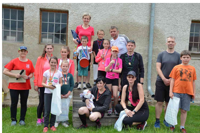
Vítězové rodinného běhu