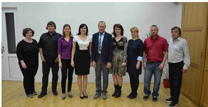
Zastupitelstvo obce Majetín