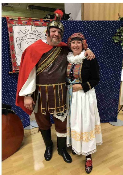
Jak se žilo na Hané

Folklórní soubor Majetínek se letos rozrostl o nové členy. V dětském souboru tančí a zpívá 36 dětí a máme již za sebou první vystoupení v Brodce u Přerova při příležitosti významného výročí vzniku republiky. V současné době pracujeme na přípravě vánočních programů. Dospělý soubor pro vás 10. listopadu připravil novinku v podobě „Posezení s mladým vínem“. Tato akce probíhala už od odpoledních hodin v místní sokolovně, kde pro vás členové souboru nachystali výstavu s názvem „Jak se žilo na Hané“. Shromáždili jsme spoustu zajímavých věcí z domácností našich babiček a prababiček a byla připravena i ochutnávka tradičních jídel. Ve večerních hodinách jsme poseděli s našimi příznivci v příjemné svatomartinské atmosféře. Soubor zazpíval několik sérií známých lidových písní, aby se k nám mohli všichni připojit. Pro naše hosty jsme měli připravené mladé víno přímo od známého vinaře a drobné pohoštění. Na této akci vládla příjemná atmosféra a už teď se těšíme na další setkání.