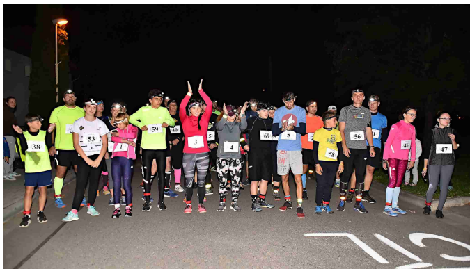
Večerní běh Majetínem