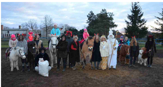
Mikuláš u koní