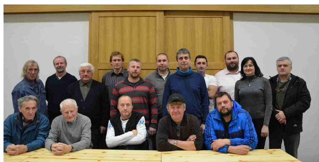
Valná hromada TJ Sokol Majetín

Hlavním cílem nově zvoleného výboru bude v dalších letech zapojení do organizovaných soutěží OFS Olomouc. Představou je začít od nejmladších benjamínků, snažit se získat u dětí zájem o fotbal agítací ve škole v Majetíně i okolí.