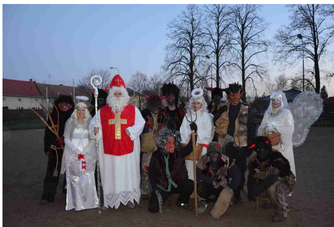
Mikuláš se svou družinou

Vydává Obec Majetín, Lipová 25, 751 03 Majetín, tel: 581 741 740, IČO 299197