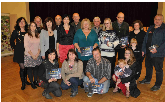
Vyhlášení fotografické soutěže