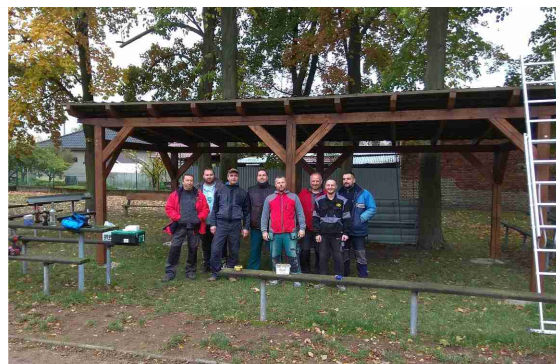
Stavba pergoly na sokolovně

Ve středu 5. 12. uspořádali hráči a příznivci Lions Majetín Mikulášskou nadílku. V podvečer vyrazila početná skupina, aby dětem, jimž rodiče návštěvu těchto bytostí objednali, přinesla radost a nadílku. Někde bylo potřeba děti trochu postrašit, jinde zase čertice a malý čertík pomáhali dětem strach překonat. Ve všech případech byly obdarované děti spokojené, stejně tak i jejich rodiče, kterým děti naslibovaly hory doly a minimálně pár dalších dní budou hodné a poslušné. Že jim to nevydrží po celý rok? Nevadí, příště se Mikuláš s andělem a čerty přijdou podívat zase. Závěrem bych chtěl poděkovat všem, co přispěli do andělského košíčku nějakou finanční částkou. Celkový výtěžek 2 300 Kč bude věnován na dobročinnou věc.