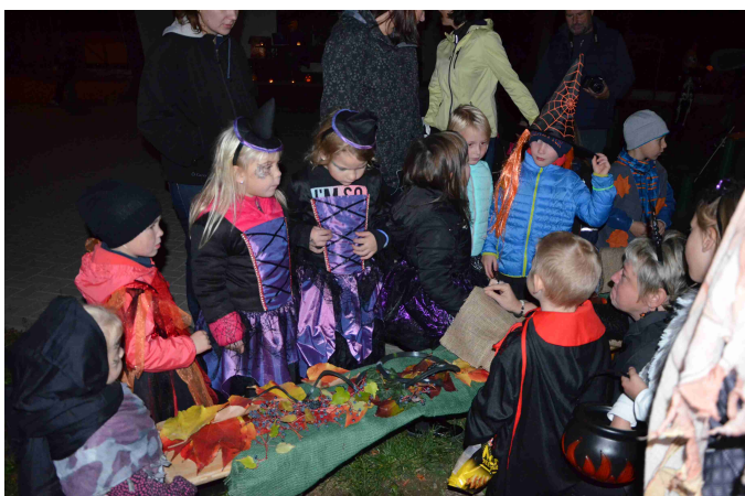
Svátek dýní a strašidel