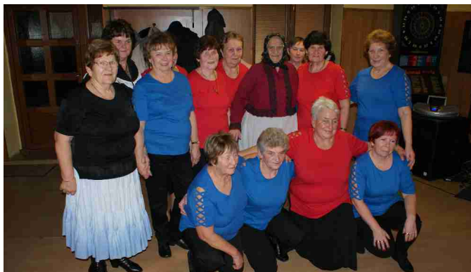
Báječný ženský v obci Kyselovice