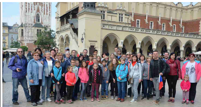
Zájezd SRPŠ do Krakova

Říjen jsme v naší škole zakončili svátkem dýní a strašidel.