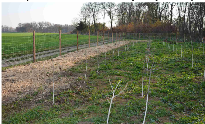
Výsadba stromů a keřů

Na podzim jsme dokončili realizaci výsadby stromů a keřů na západní části katastru u Dubu nad Moravou, na kterou jsme získali 90% dotaci z Programu péče o krajinu.