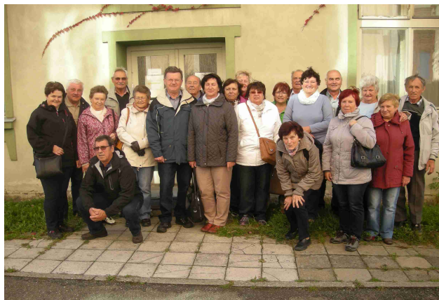
Zájezd klubu seniorů