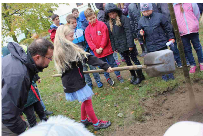
Sázení lípy k oslavě 100 let ČSR