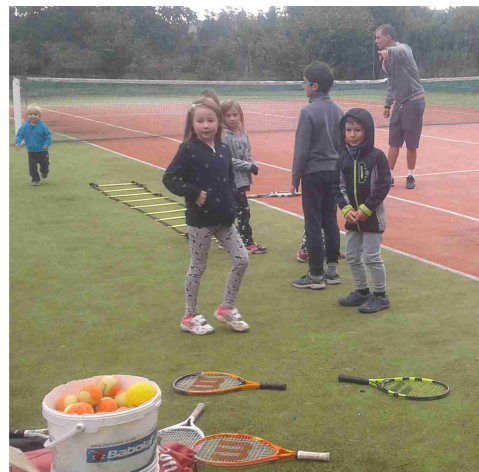
Seznámení s tenisem