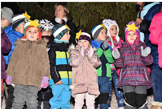
Rozsvícení vánočního stroměčku