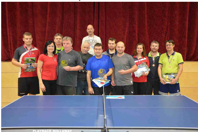
Smeč starostky obce – kategorie dospělí