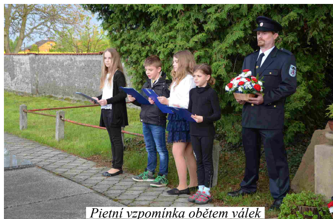
Pietní vzpomínka obětem válek