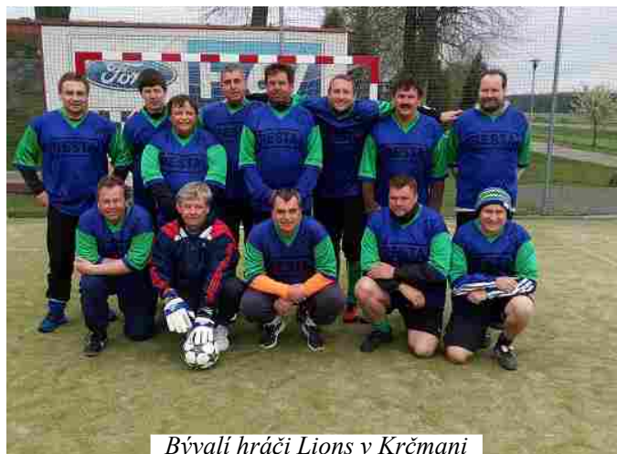
Bývalí hráči Lions v Krčmani