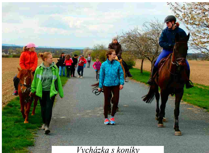
Vycházka s koníky