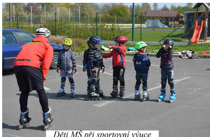
Děti MŠ při sportovní výuce