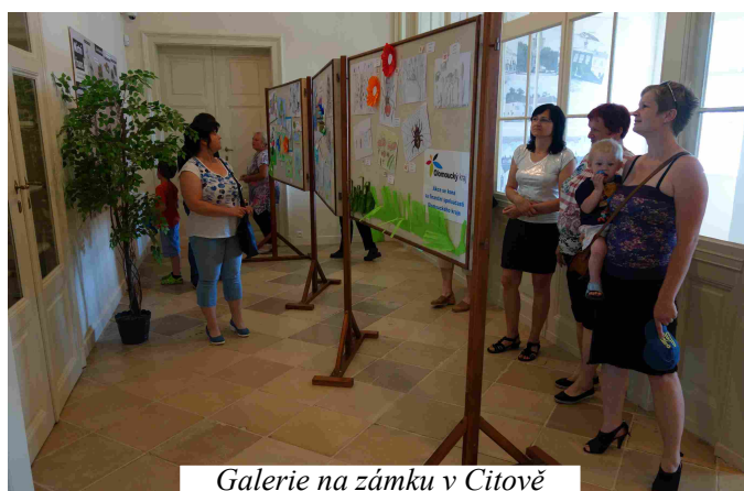
Galerie na zámku v Citově