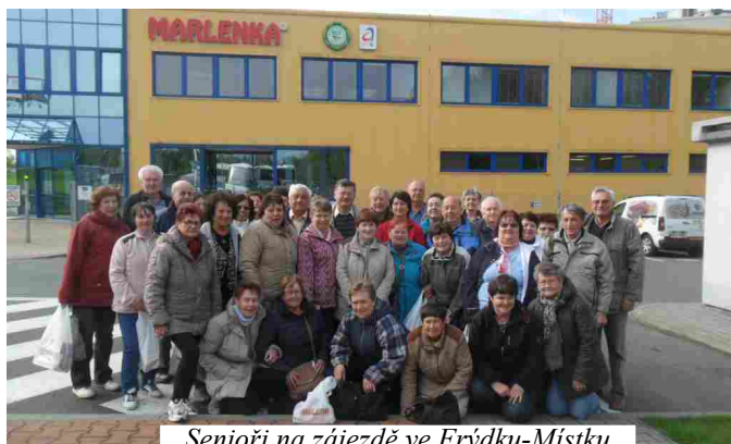
Senioři na zájezdě ve Frýdku-Místku

Náš Senior klub, který má dnes 42 členů, byl založen mezi prvními v okrese Olomouc. Dne 25. 1. 1997 na první schůzku přišlo přes 40 seniorů a od té doby se již 20 let scházíme každé poslední úterý v měsíci k posezení a besedě. Dvacet let nám sloužila zasedací místnost obecního