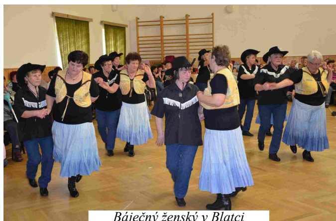
Báječný ženský v Blatci