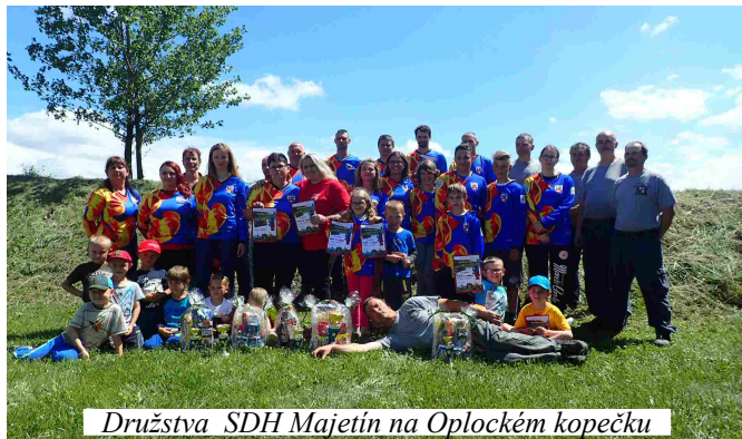
Družstva SDH Majetín na Oplockém kopečku

Dne 10. 6. 2017 se všechna sportovní družstva již tradičně účastnila 7. ročníku Oplockej kopeček. Kde i za nepříznivého počasí si příprava odvezla 1. místo, mladší děti 2. místo, starší děti krásné 1. místo, ženy 3. místo, muži 7. místo, veteráni 3. místo a veteráni - stará garda