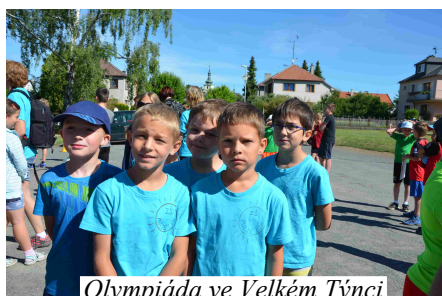
Olympiáda ve Velkém Týnci