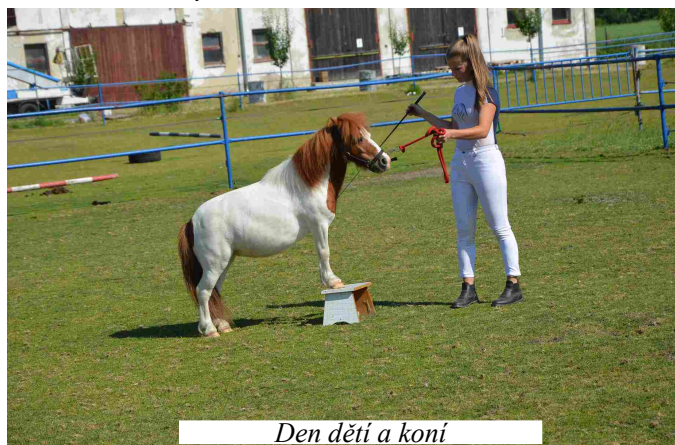
Den dětí a koní