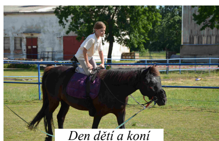
Den dětí a koní

Další akcí, kterou jsme pořádal, byl 2. ročník Majetínského běhu na 5 a 10 km a Rodinný běh. Počasí nám opět