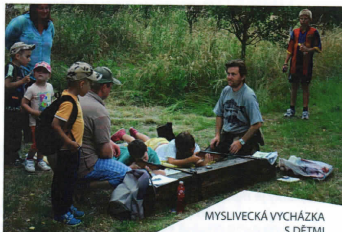
MYSLIVECKÁ VYCHÁZKA S DĚTI