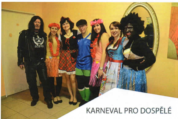
KARNEVAL PRO DOSPĚLÉ