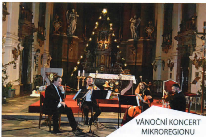
VÁNOČNÍ KONCERT MIKROREGIONU