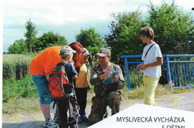
MYSLIVECKÁ VYCHÁZKA S DĚTI