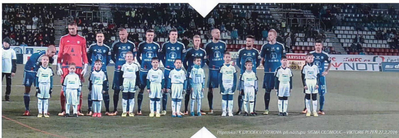
Příprava FK BRODEK U PŘEROVA při nástupu SIGMA OLOMOUC – VIKTORIE PLZEŇ 27.2.2016