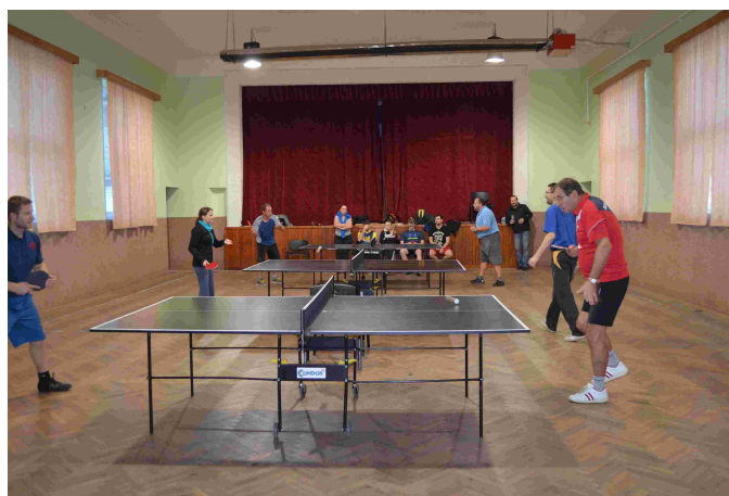
Smeč starostky obce