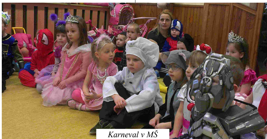
Karneval v MŠ