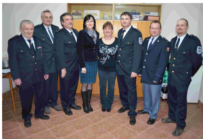
Výbor SDH Majetín