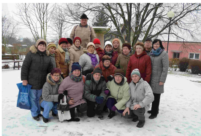
Novoroční vycházka seniorů