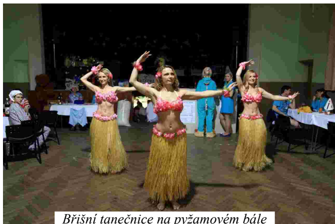
Břišní tanečnice na pyžamovém bále

Zpestřením programu bylo i vystoupení břišních tanečnic a barmanské šou. Poděkování patří organizátorům všech plesů, nejenom obecního, ale i plesů pořádaných zástupci místních spolků – Majetínek, T.J. Sokol a SRPŠ. Ráda bych poděkovala také všem spoluobčanům, kteří se osobně zúčastnili nebo akci finančně podpořili při zvaní. Bez této podpory by se nemohly všechny výdaje s pořádáním plesu