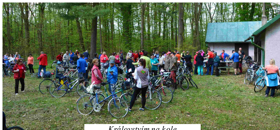
Královstvím na kole

zentoval folklórní soubor Majetínek a country taneční skupina Báječný ženský. Další akce „Královstvím na kole“ se uskutečnila 20. dubna. Přes 250 účastníků se sjelo v lese Království u chaty Královny. Po menší projížďce lesem a návštěvě