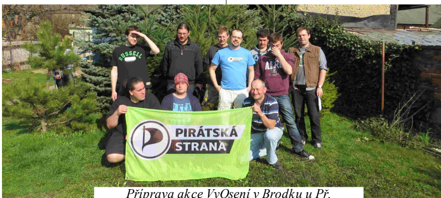
Příprava akce Vyosení v Brodku u Př.

Rádi bychom sestavili kandidátku i pro komunální volby v Majetíně a rozšířili tak počet kandidátů do zastupitelstva. Naším cílem je aktivizovat (nejen) mladé lidi, aby se více zajímali o dění v obci a třeba i přispěli ke zlepšení života v ní.