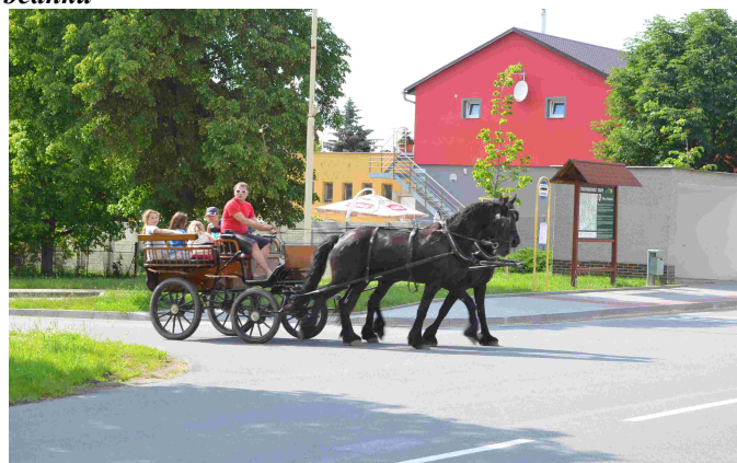
Den dětí u koní