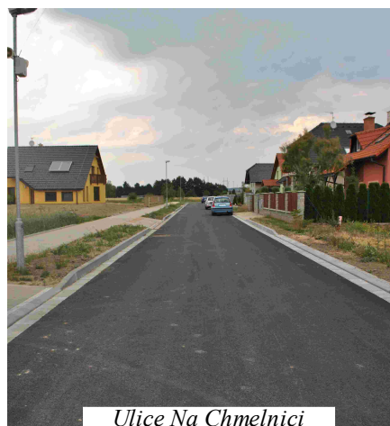
Ulice Na Chmelnici

2. Bylo dokončeno prodloužení komunikace, chodníku a vodovodu v ulici Na Chmelnici za cenu 1,5 mil.