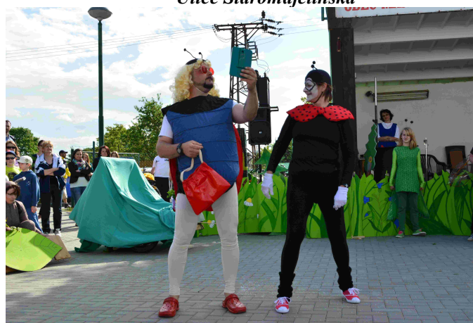
Ulice Na Chmelnici