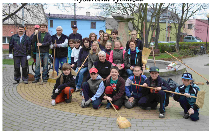
Společně za krásnější Majetín