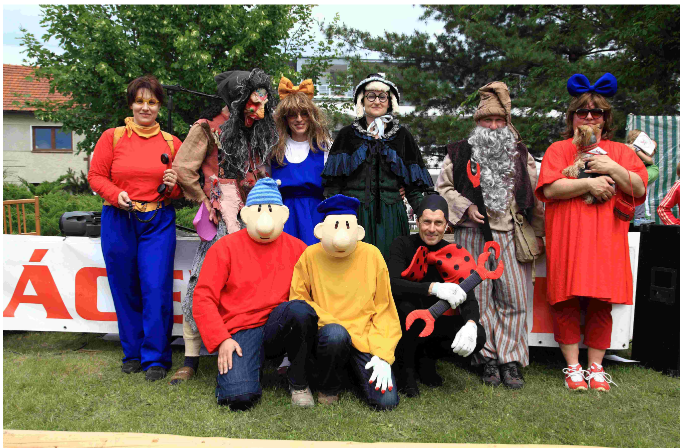
Kácení máje 2014 - Majetínský Večerníček