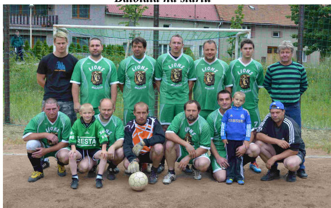
Lions Majetín v ročníku 2013-2014