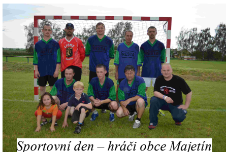
Sportovní den – hráči obce Majetín

1. března byla vyhlášena fotografická soutěž ve dvou kategoriích: Lidé a Svět zvířat. Podmínky fotosoutěže: autorem je občan mikroregionu, fotografie vel. A4 musí být vytištěny na fotografickém papíře, popis fotografie musí obsahovat jméno, adresu, telefon autora, kategorii. Jeden občan může do soutěže přihlásit maximálně 4 snímky do každé