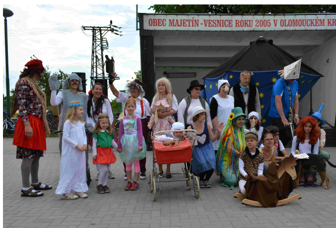
Ulice Náves + Kokorská + Polní