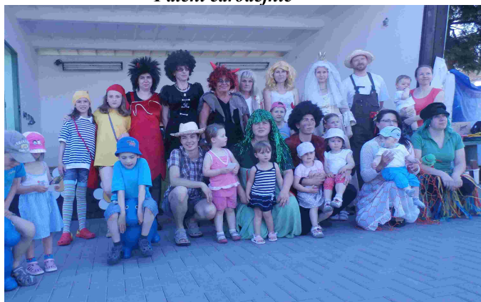
Batolata na startu