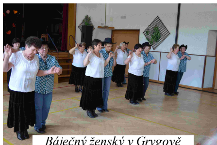
Báječný ženský v Grygově

V obcích mikroregionu bylo uskutečněno v letošním roce již několik kulturních a sportovních akcí.