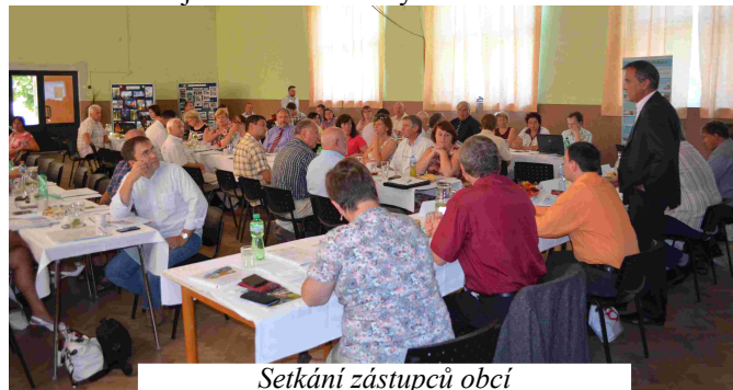
Setkání zástupců obcí