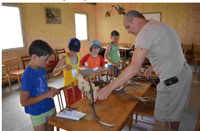
Myslivecká vycházka – foto: M. Zavadilová