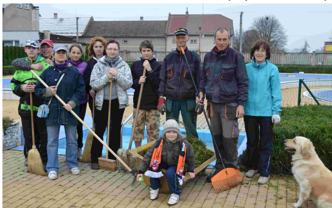
Brigáda ke Dni země – foto: M. Zavadilová