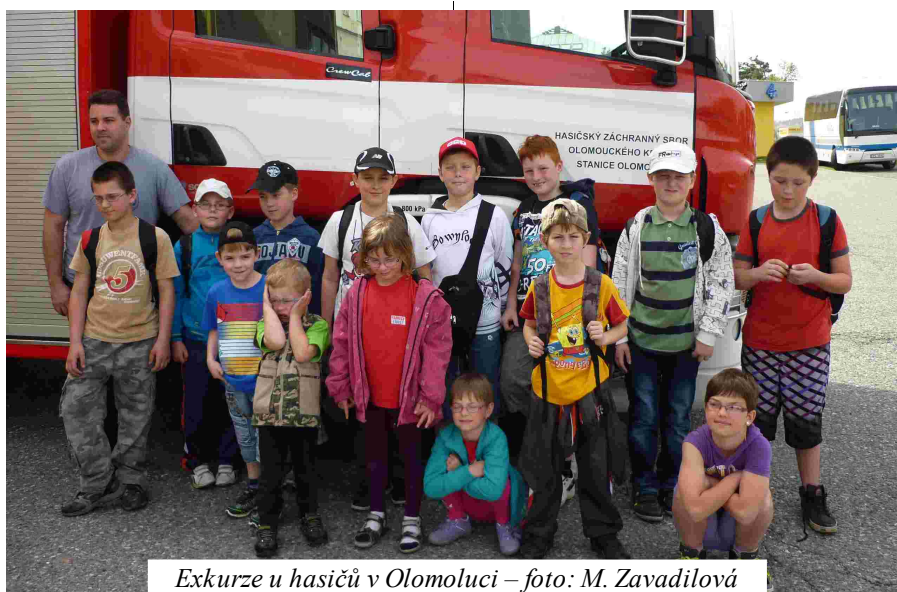
Exkurze u hasičů v Olomoluci

Mladí hasiči se pravidelně scházejí od září loňského roku každý pátek v hasičské zbrojnici. Vzhledem k deštivému jarnímu období začali později s tréninkem požárního útoku, přesto se jim na soutěžích ve Velkém Újezdu a Dubu nad Moravou podařil zvládnout s dobrým výsledkem. V rámci celoroční hry Plamen si také vyzkoušeli soutěž štafety 4x 60 m a štafety dvojic.