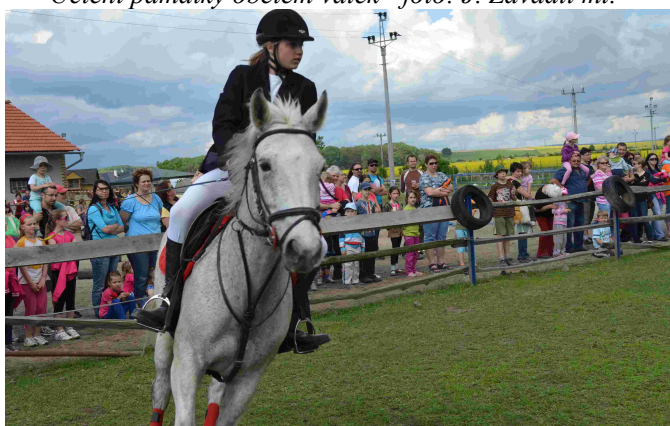
Dětský den u koní