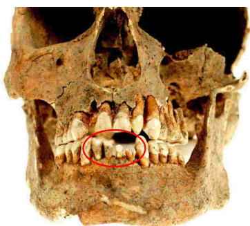
Lebka jednoho z mužů pohřbených pod božími mukami v Majetíně. Poškození dolních řezáku otevíráním papírových nábojů označeno kroužkem.

Díky tomuto výzkumu jsme mohli nahlédnout do ne tak vzdálených dějin Majetína. Archeologie ani antropologie nemůže nabídnout jednoznačné odpovědi na zdánlivě jednoduché otázky, jedině co můžeme říci je, že život v žádném historickém období nebyl jednoduchý. Pracovníci Archeologického centra Olomouc tímto děkují vedení obce a místním občanům za projevenou ochotu během našeho výzkumu v Majetíně.