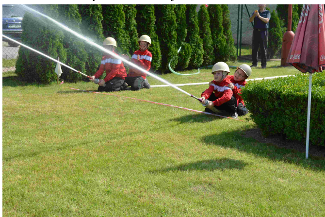
Setkání mladých hasičů