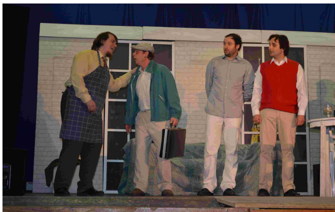
Divadlo J. K. Tyla z Brodku