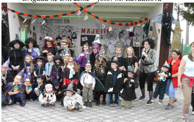
Pálení čarodějnic