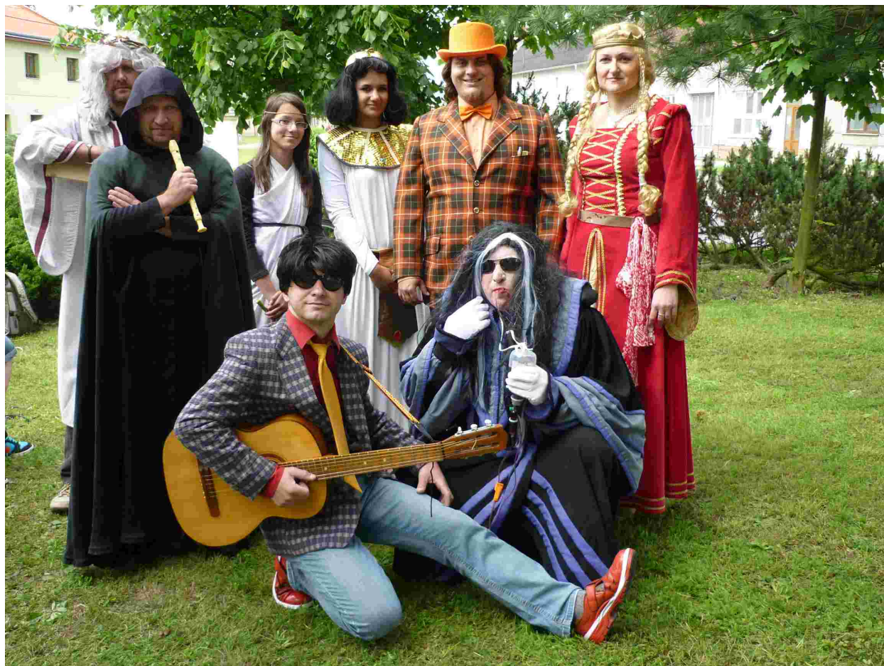
Kácení máje - foto: P. Kulková, M. Zavadilová ml.