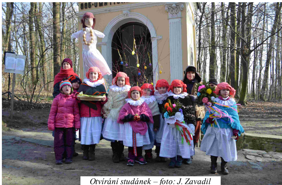
Otvírání studánek

pěvecké i taneční vystoupení a hostem večera byl hanácký soubor Hanák z Troubek nad Bečvou. Dětský