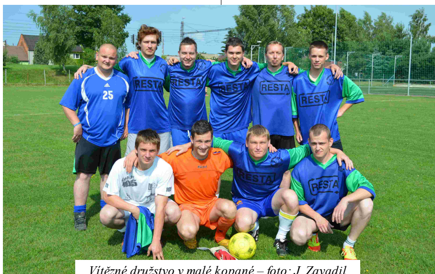
Vítězné družstvo v malé kopané