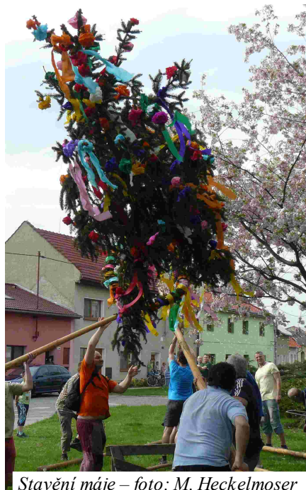
Stavění máje

silných mužů postavili na návsi májku, kterou nazdobily čarodějnice a čarodějové. Následoval průvod účastníků do areálu za saunou, kde připravily členky školské a kulturní komise hry a soutěže.