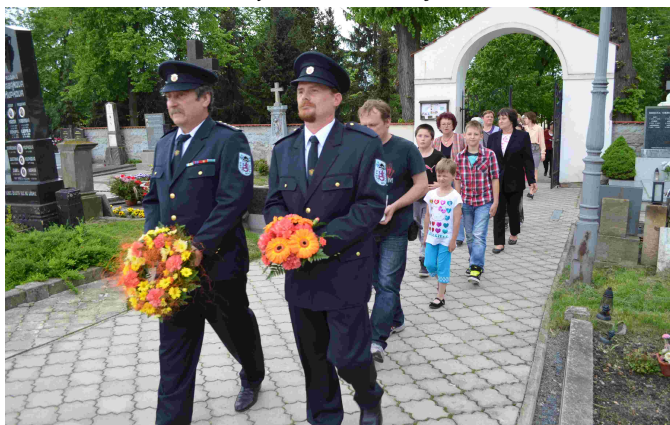
Uctění památky obětem válek