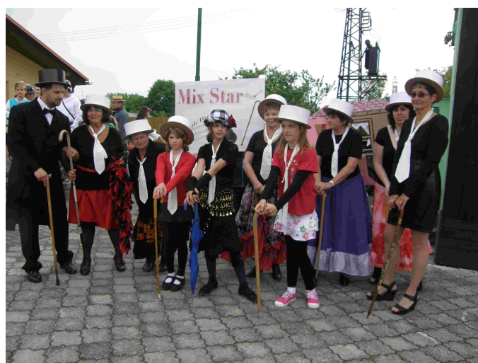
Kácení máje - Majetínský muzikál