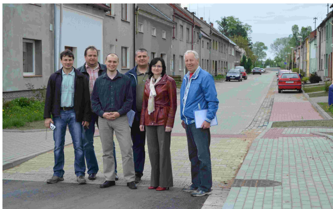
Kolaudace komunikace ul. Novostavby