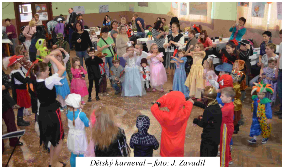
Dětský karneval