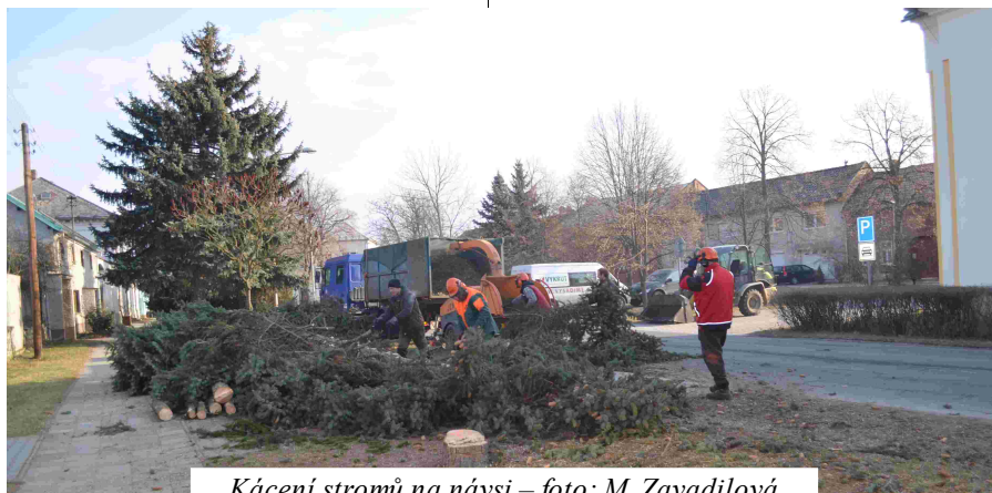
Kácení stromů na návsi

Věřím, že nová zeleň bude pro naši obec přínosem, dojde k pročištění, prosvětlení a ke sjednocení rázu celé obce. Dosavadní výsadba byla prováděna bez komplexního pojetí. Byly sázeny jehličnaté stromy, které se hodí především do lesů a horských krajín, ne do hanácké obce. Kácení těchto stromů mnohé spoluobčany zasáhl, především tím, že je třeba sami vysadili a viděli vyrůstat, což je pochopitelné. Kácení bylo provedeno nejenom z důvodu estetického, ale také zdravotního. Většina byla již přerostlá a přestárlá ohrožující okolí.