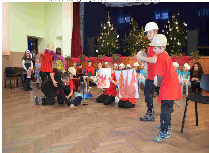
Vystoupení mladých hasičů a dětí MŠ při setkání seniorů