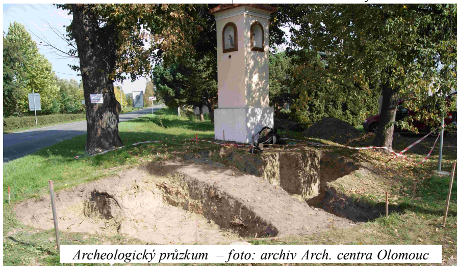
Archeologický průzkum

V této době nebyl v obci žádný hřbitov, kostel ani matrika, takže veškeré církevní obřady se konaly ve vedlejších Kokorách.