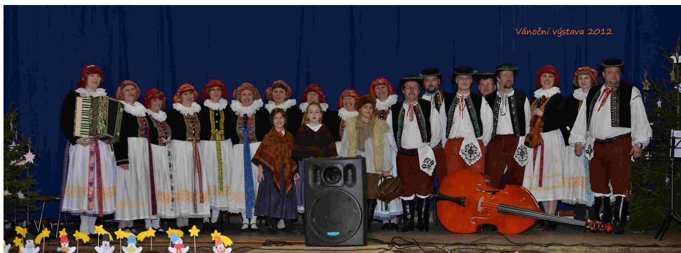
Majetínek na vánoční výstavě