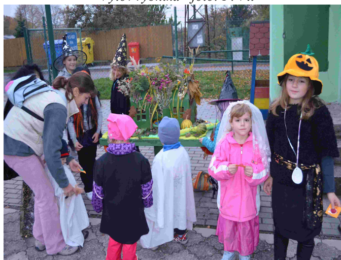
Svátek dýní