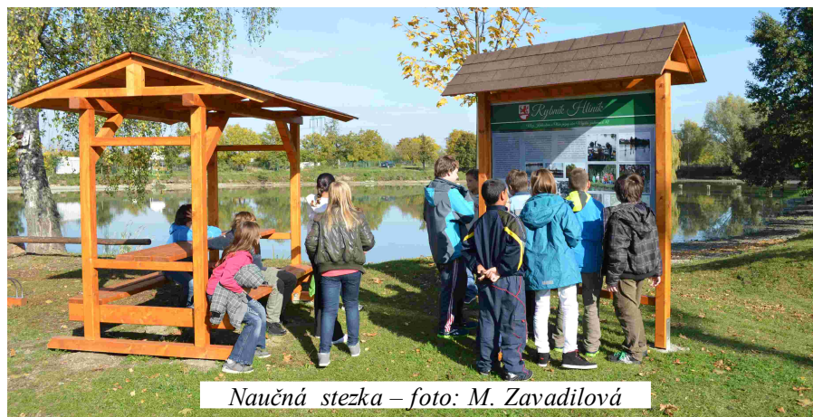
Naučná stezka

Z posledních akcí vzpomenu alespoň rozsvícení stromečku, vánoční výstavu a setkání seniorů v sokolovně, které organizačně zajišťují členky školské a kulturní komise ve spolupráci s obecním úřadem. Jejich práci před akcí a také po jejím ukončení většina lidí nevidí a tím pádem nedokáže ocenit. Také vystupující mají velký obdiv. Na rozsvícení stromečku nám děti přednesly básničky, na výstavě zahrál a zazpíval folklórní soubor Majetínek, na setkání seniorů vystoupily děti z tanečního a hasičského kroužku a také nás mile překvapily členky country taneční skupiny Báječný ženský s černošským tancem. Další úspěšnou předvánoční akcí byla Mikulášská nadílka u koní, kterou uspořádalo občanské sdružení Koník dětem a dospělým pro radost. Děti se Mikuláši představily s básničkou či říkankou a za odměnu je čerti povozili na koních kolem jízdárny.