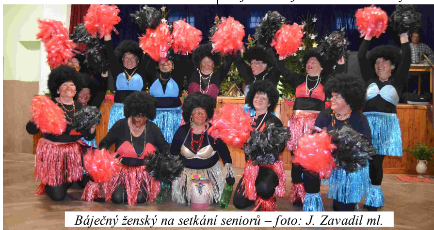
Báječný ženský na setkání seniorů

Projekt „Obnova zeleně ve vybraných částech obce“ ještě zahájen nebyl, i když příslib dotace z Operačního programu životního prostředí byl oznámen již začátkem roku. Jedná se o stejný problém jako s opožděním opravy komunikace v ulici Novostavby – nový zákon o veřejných zakázkách a dlouhé čekání na prováděcí vyhlášku. Zadávací podmínky byly zavčas připraveny, ale další problém nastal při jejich schvalování na kontrolním dotačním