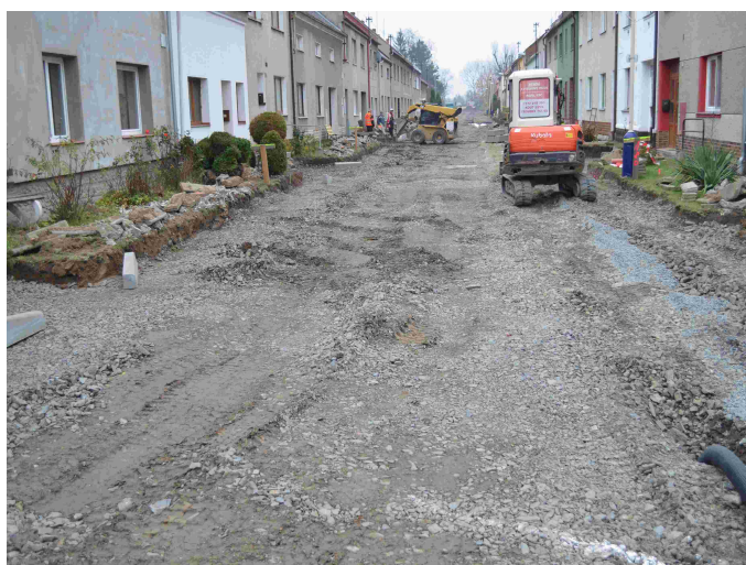
Rekonstrukce ul. Novostavby