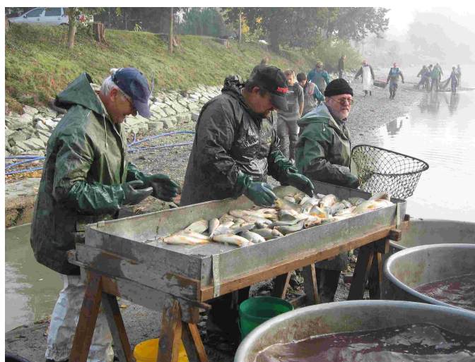
Výlov rybníka