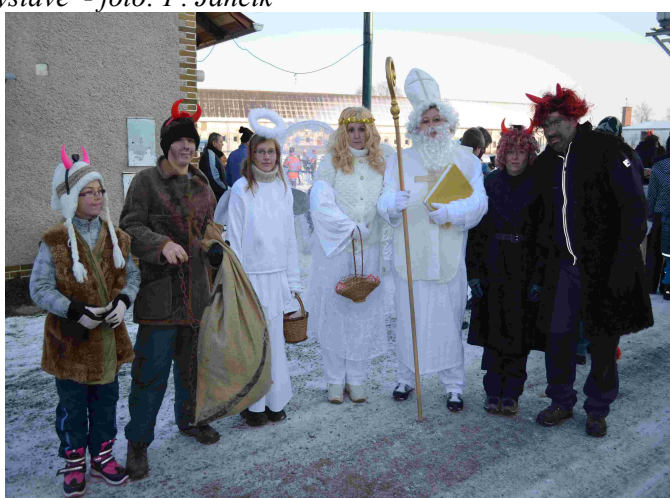
Mikuláš u koní