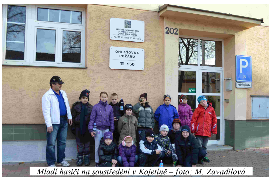
Mladí hasiči na soustředění v Kojetíně