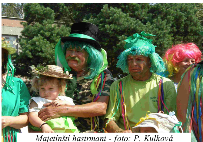
Majetínští hastrmani