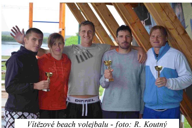
Vítězové beach volejbalu