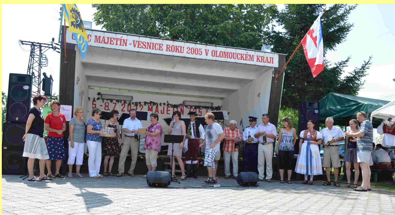
Folklorní kroužek Majetínek, večerní ohňostroj, křest knihy Majetín v proměnách času