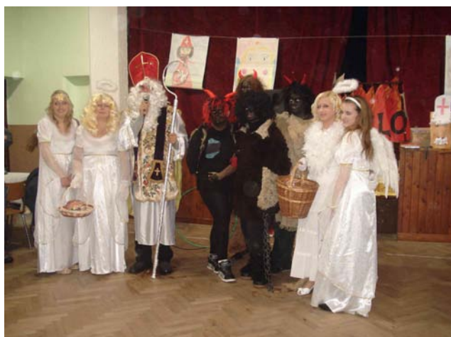
Mikuláš v sokolovně