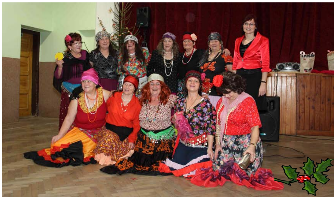
Báječný ženský na setkání seniorů