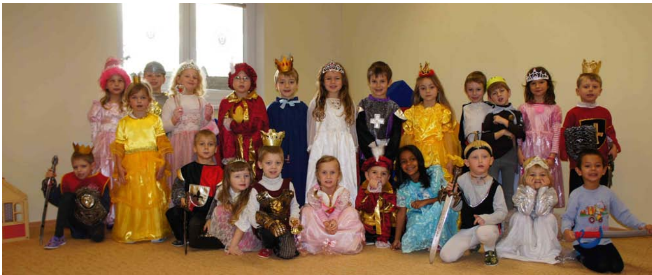
Den princů a princezen v MŠ