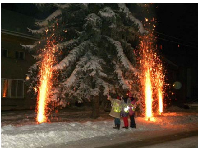
Světlušky při rozsvícení stromku