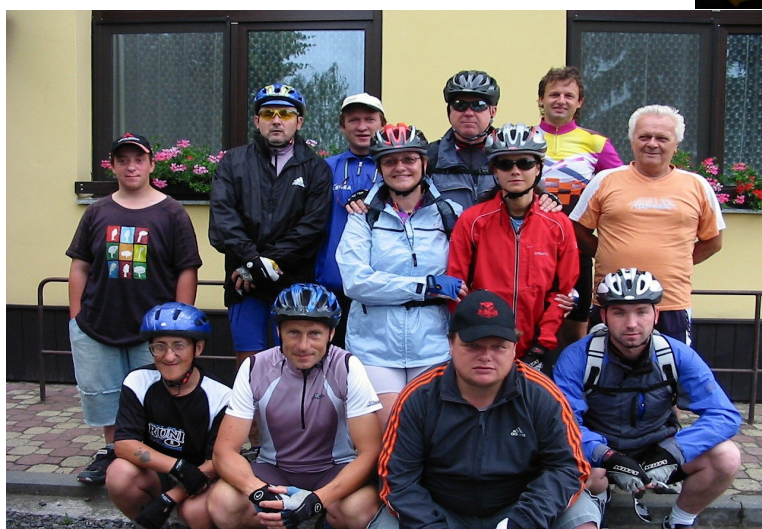
kolaři před vyjížd'kou