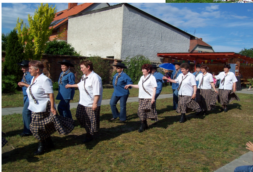
Báječný ženský v DPS