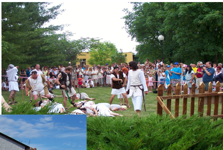
dívčí válka