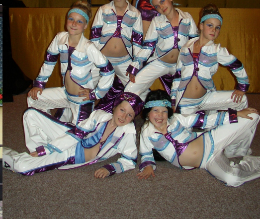
vícemistři světa