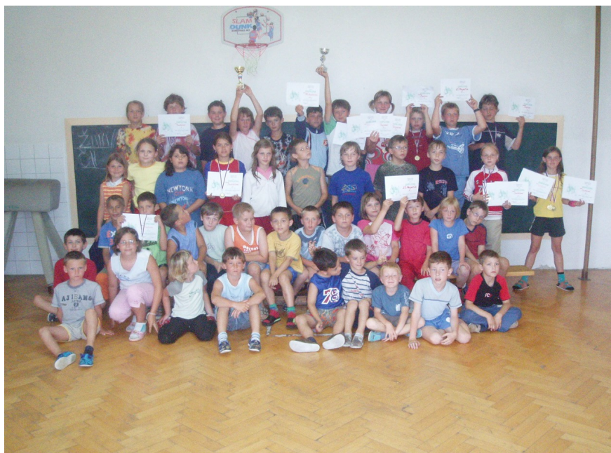
Děti ZŠ Majetín